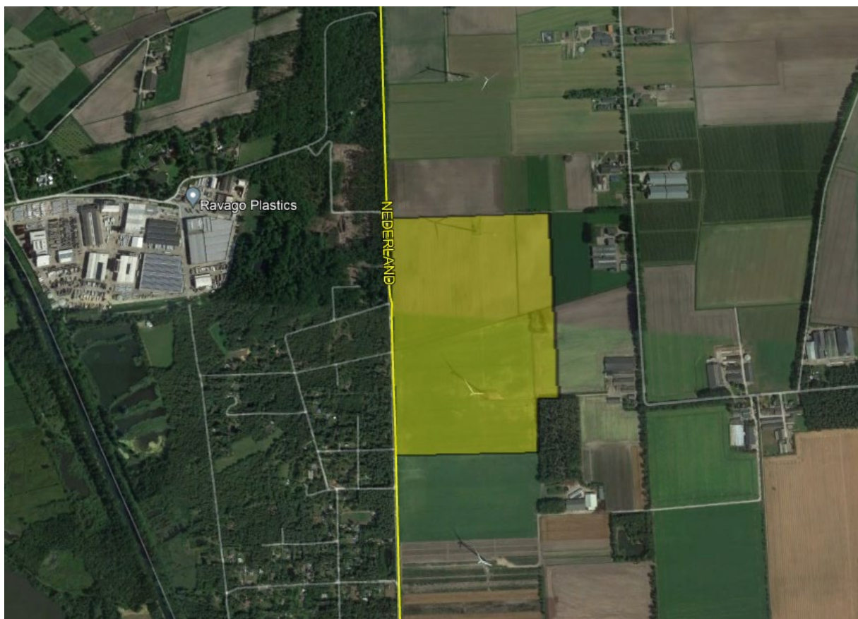
Figuur 1: Luchtfoto omgeving van het plangebied met daarop in het geel het plangebied van het gehele Zonnepark Laarakkerdijk Veld 1 en Veld 2 aangegeven. Ten westen van plangebied de Belgische grens met Natura 2000 gebied Vennen, heiden en moerassen rond Turnhout .

Het plangebied bestaat uit meerdere akkerbouwpercelen waarop twee windmolens staan. Langs de westzijde is het Natura 2000 gebied Vennen, heiden en moerassen rond Turnhout gelegen, langs de noord-, zuid- en oostzijde enkele agrarische percelen, ten zuidoosten een bestaand bosperceel en ten oosten een vijver omringd door een bomen. In het grotere gebied staan in totaal vijf windturbines in lijn. In Figuur 1 is een luchtfoto van het plangebied en de directe omgeving weergegeven.