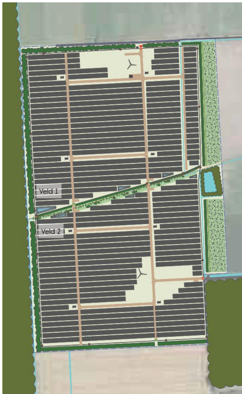
Figuur 2: Landschappelijk inpassingsplan voor Zonnepark Laarakkerdijk Veld 1 en Veld 2.

plaatsen. Binnen het plangebied worden meerdere poelen en een patrijzenhaag aangelegd. Langs de bosrand wordt de mantel-zoomvegetatie versterkt. Langs de noordrand wordt struweel aangelegd. De toekomstige situatie zoals beschreven is weergegeven in Figuur 2.