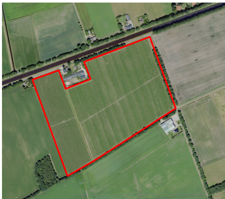
Figuur 1. percelen omgevingsvergunning

Wij hebben besloten op basis van onderstaande motivering aan u op basis van artikel 5.1 lid 2, aanhef en onder g, van de Omgevingswet (Ow) in samenhang met art. 11.37 en art. 11.40 van het Besluit activiteiten leefomgeving (Bal) een omgevingsvergunning te verlenen voor het doden van houtduiven, zwarte kraaien en kauwen met behulp van geweer ter ondersteuning van de aangebrachte preventieve middelen vanaf één uur voor zonsopkomst ter voorkoming van belangrijke schade aan kwetsbare gewassen op de percelen uit uw aanvraag zoals weergegeven op onderstaande figuur 1.