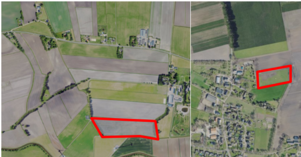
Figuur 1. percelen omgevingsvergunning

Wij hebben besloten op basis van onderstaande motivering aan u op basis van artikel 5.1 lid 2, aanhef en onder g, van de Omgevingswet (Ow) in samenhang met art. 11.37 en art. 11.40 van het Besluit activiteiten leefomgeving (Bal) een omgevingsvergunning te verlenen voor het doden van roeken met behulp van geweer ter ondersteuning van de aangebrachte preventieve middelen vanaf één uur voor zonsopkomst ter voorkoming van belangrijke schade aan kwetsbare gewassen op de percelen uit uw aanvraag zoals weergegeven op onderstaande figuur 1.