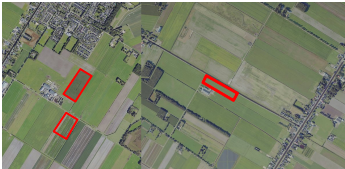
Figuur 1. percelen omgevingsvergunning

Wij hebben besloten op basis van onderstaande motivering aan u op basis van artikel 5.1 lid 2, aanhef en onder g, van de Omgevingswet (Ow) in samenhang met art. 11.37 en art. 11.40 van het Besluit activiteiten leefomgeving (Bal) een omgevingsvergunning te verlenen voor het doden van roeken met behulp van geweer ter ondersteuning van de aangebrachte preventieve middelen vanaf één uur voor zonsopkomst ter voorkoming van belangrijke schade aan kwetsbare gewassen op de percelen uit uw aanvraag zoals weergegeven op onderstaande figuur 1.