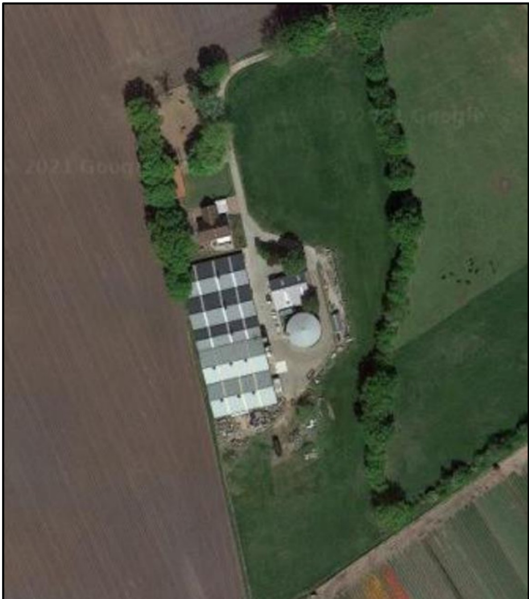
Figuur 1: luchtfoto projectlocatie Oud Avereest 32 te Balkbrug

De veehouderij is gelegen aan de Oud Avereest 32 te Balkbrug. Het perceel is kadastraal bekend als de gemeente Avereest, sectie F, nummer 3015. De projectlocatie is gelegen in het buitengebied van de gemeente Hardenberg.