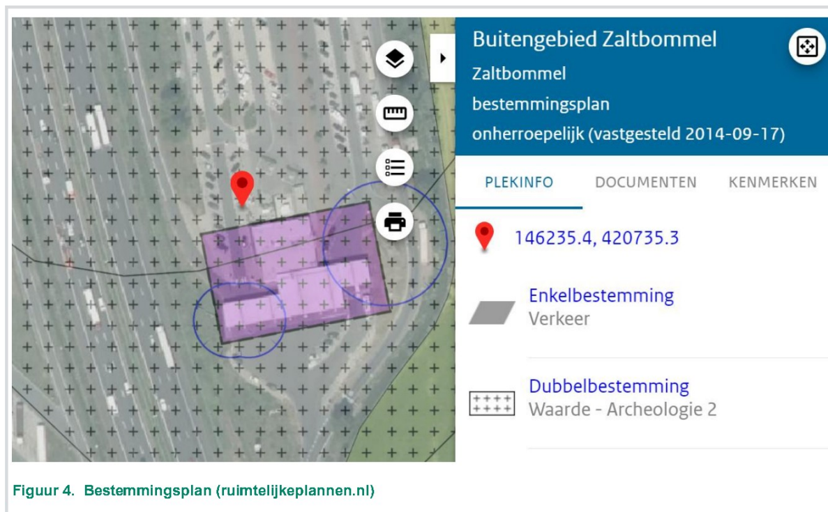
Figuur 4. Bestemmingsplan (ruimtelijkeplannen.nl)

De locatie bevindt zich binnen het bestemmingsplan Buitengebied Zaltbommel , onherroepelijk vastgesteld op 17 september 2014.