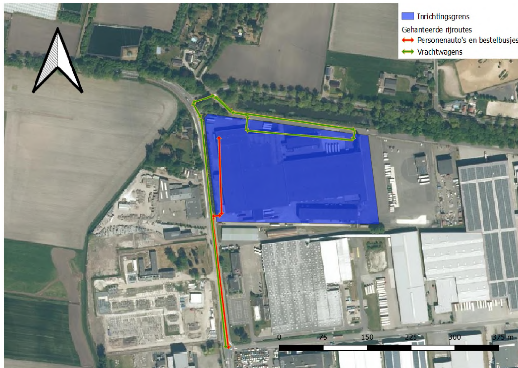
f3.2 Gehanteerde rijroutes