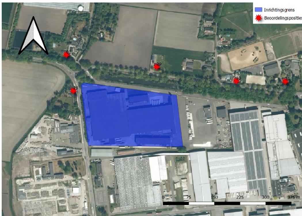
f3.1 Situering van de inrichting in de omgeving met beoordelingsposities

Op het industrieterrein 'Vosdonk' is Arena Warehousing B.V. (hierna: Arena) gevestigd aan de Hoevenseweg 41-43. Arena verzorgt onder andere containervervoer over de weg. Daarnaast richt Arena zich op groupagevervoer naar de Benelux, Frankrijk, Engeland en Schotland. Groupagevervoer is het samenvoegen van verschillende kleine ladingen tot één grote lading. Binnen de inrichting vindt tevens opslag van goederen in de loodsen plaats. Het voornemen bestaat om de bestaande bebouwing te slopen en geheel nieuw te bouwen. Daarmee zal ook capaciteitsuitbreiding worden gerealiseerd. In figuur 3.1 is de situering van de inrichting en de beoordelingsposities in de omgeving weergegeven.