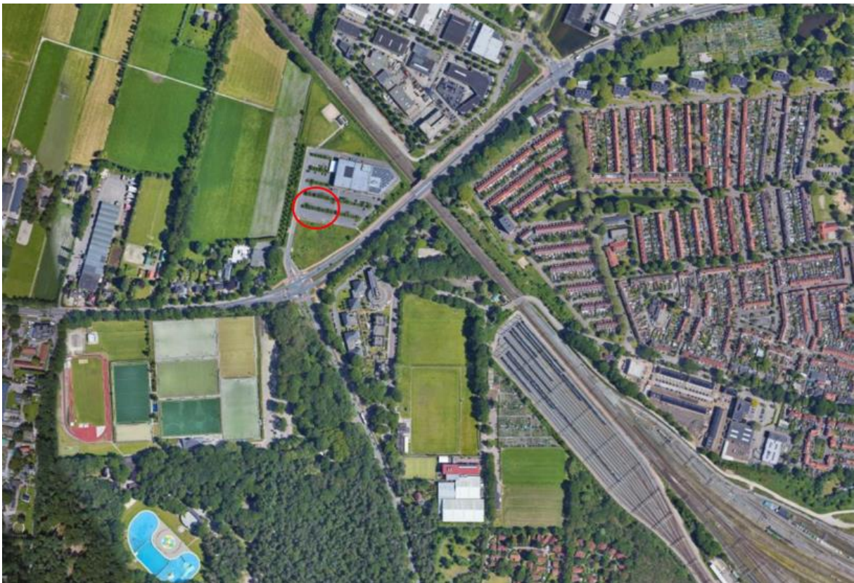
Figuur 1. Ligging van het plangebied

Het plangebied ligt aan de Middelhoefseweg aan de westkant van Amersfoort. Op navolgende luchtfoto is de ligging van het plangebied in de omgeving weergegeven.