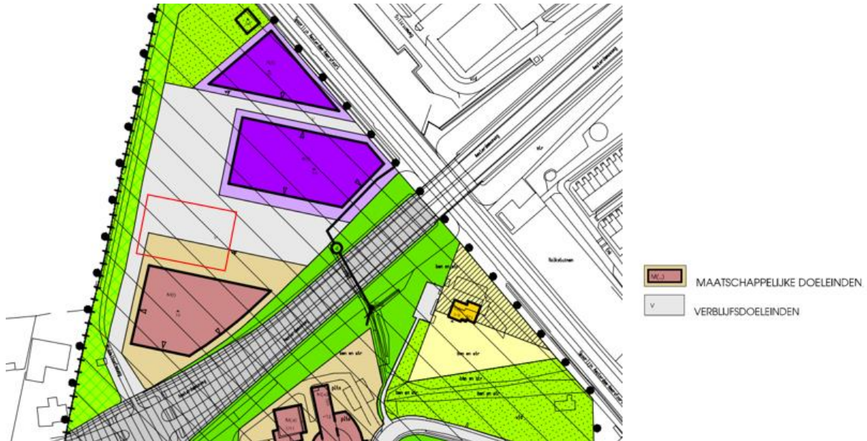
Figuur 2. Uitsnede bestemmingsplan 'Birkhoven Bokkeduinen', in rood de globale grenzen van onderhavig plan.

De beoogde ontwikkeling past qua bestemming en qua bouwmaatvoering niet binnen het bestemmingsplan. Daarom wordt voor voorliggend plan een uitgebreide omgevingsvergunning procedure doorlopen om het initiatief mogelijk te maken.