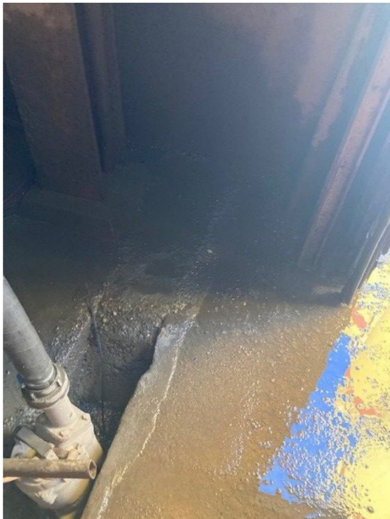
Foto 2-1 Vml. goot binnenzijde ERI-gebouw

Foto's van de afsluiting van de goot met een betonprop.