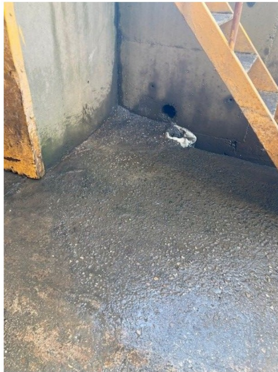
Foto 2-2 Vml. goot buitenzijde ERI-gebouw