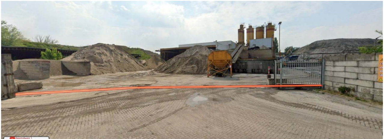
Afbeelding 1-2 Foto (Streetview) inrit Beemdweg 1, met impressie ligging goot.