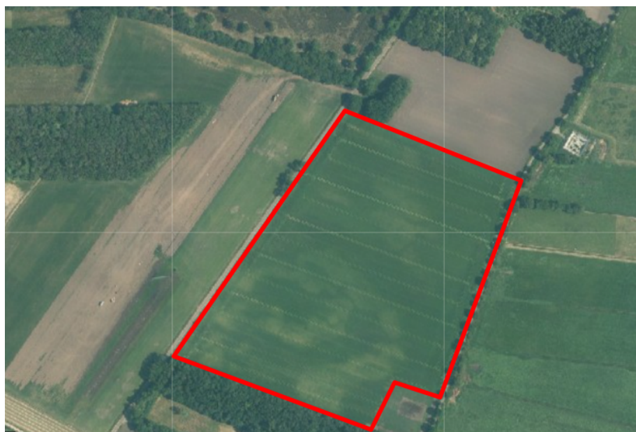
Figuur 1. percelen omgevingsvergunning

Wij hebben besloten op basis van onderstaande motivering aan u op basis van artikel 5.1 lid 2, aanhef en onder g, van de Omgevingswet (Ow) in samenhang met art. 11.37 en art. 11.40 van het Besluit activiteiten leefomgeving (Bal) een omgevingsvergunning te verlenen voor het doden van roeken met behulp van geweer ter ondersteuning van de aangebrachte preventieve middelen vanaf één uur voor zonsopkomst ter voorkoming van belangrijke schade aan kwetsbare gewassen op de percelen uit uw aanvraag zoals weergegeven op onderstaande figuur 1.