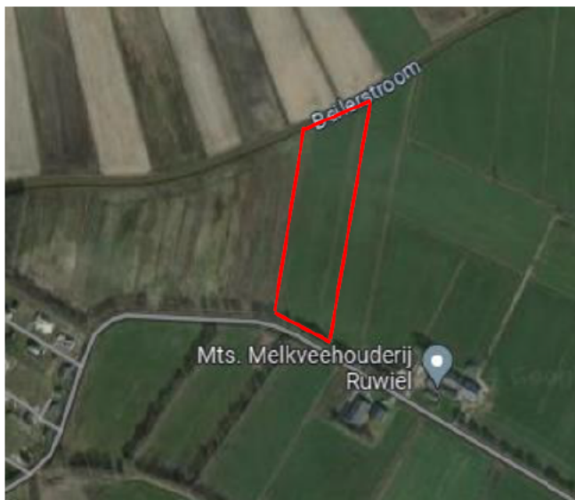
Figuur 1. percelen omgevingsvergunning

Wij hebben besloten op basis van onderstaande motivering aan u op basis van artikel 5.1 lid 2, aanhef en onder g, van de Omgevingswet (Ow) in samenhang met art. 11.37 en art. 11.40 van het Besluit activiteiten leefomgeving (Bal) een omgevingsvergunning te verlenen voor het doden van zwarte kraaien en kauwen met behulp van geweer ter ondersteuning van de aangebrachte preventieve middelen vanaf één uur voor zonsopkomst ter voorkoming van belangrijke schade aan kwetsbare gewassen op de percelen uit uw aanvraag zoals weergegeven op onderstaande figuur 1.