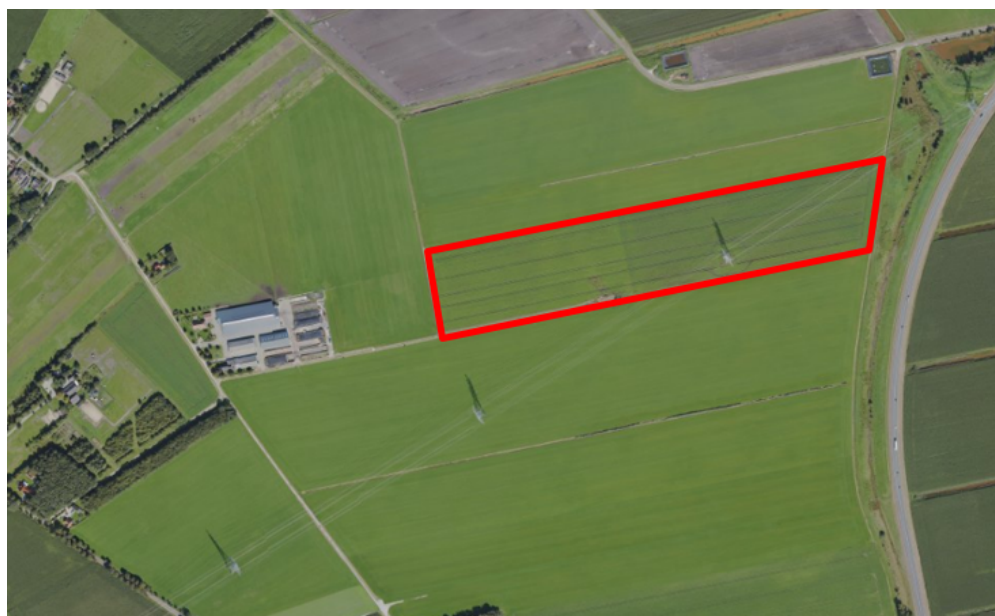
Figuur 1. percelen omgevingsvergunning

Wij hebben besloten op basis van onderstaande motivering aan u op basis van artikel 5.1 lid 2, aanhef en onder g, van de Omgevingswet (Ow) in samenhang met art. 11.37 en art. 11.40 van het Besluit activiteiten leefomgeving (Bal) een omgevingsvergunning te verlenen voor het doden van roeken, zwarte kraaien en kauwen met behulp van geweer ter ondersteuning van de aangebrachte preventieve middelen vanaf één uur voor zonsopkomst ter voorkoming van belangrijke schade aan kwetsbare gewassen op de percelen uit uw aanvraag zoals weergegeven op onderstaande figuur 1.