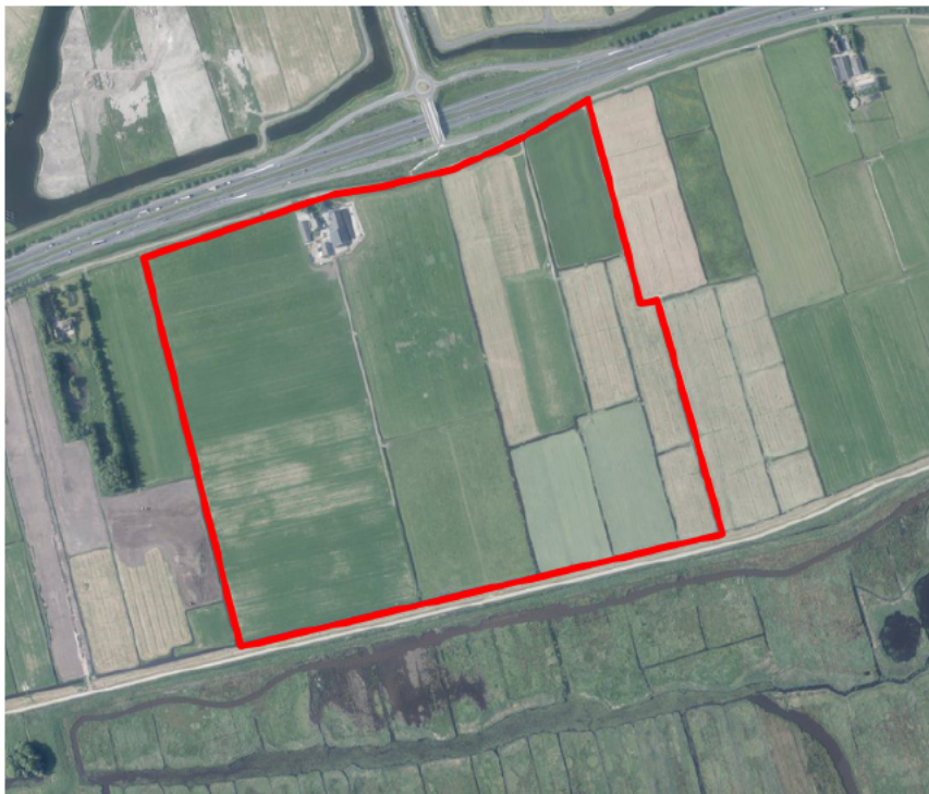
Figuur 1. percelen omgevingsvergunning

Wij hebben besloten op basis van onderstaande motivering aan u op basis van artikel 5.1 lid 2, aanhef en onder g, van de Omgevingswet (Ow) in samenhang met art. 11.37 en art. 11.40 van het Besluit activiteiten leefomgeving (Bal) een omgevingsvergunning te verlenen voor het doden van grauwe ganzen met behulp van geweer ter ondersteuning van de aangebrachte preventieve middelen vanaf één uur voor zonsopkomst ter voorkoming van belangrijke schade aan kwetsbare gewassen op de percelen uit uw aanvraag zoals weergegeven op onderstaande figuur 1.