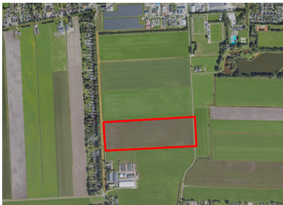
Figuur 1. percelen omgevingsvergunning

Wij hebben besloten op basis van onderstaande motivering aan u op basis van artikel 5.1 lid 2, aanhef en onder g, van de Omgevingswet (Ow) in samenhang met art. 11.37 en art. 11.40 van het Besluit activiteiten leefomgeving (Bal) een omgevingsvergunning te verlenen voor het doden van roeken met behulp van geweer ter ondersteuning van de aangebrachte preventieve middelen vanaf één uur voor zonsopkomst ter voorkoming van belangrijke schade aan kwetsbare gewassen op de percelen uit uw aanvraag zoals weergegeven op onderstaande figuur 1.