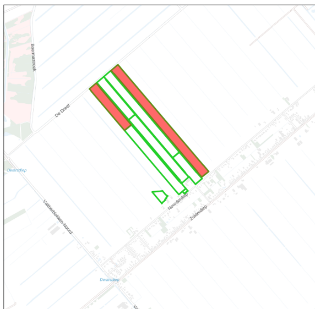
Figuur 1. percelen (rood) omgevingsvergunning

Wij hebben besloten op basis van onderstaande motivering aan u op basis van artikel 5.1 lid 2, aanhef en onder g, van de Omgevingswet (Ow) in samenhang met art. 11.37 en art. 11.40 van het Besluit activiteiten leefomgeving (Bal) een omgevingsvergunning te verlenen voor het doden van roeken met behulp van geweer ter ondersteuning van de aangebrachte preventieve middelen vanaf één uur voor zonsopkomst ter voorkoming van belangrijke schade aan kwetsbare gewassen op de percelen uit uw aanvraag zoals weergegeven op onderstaande figuur 1.