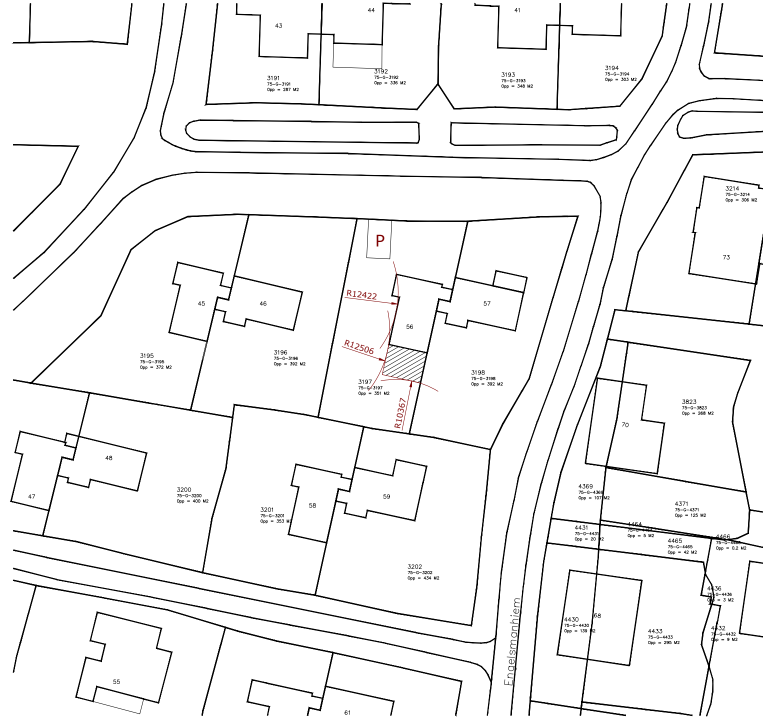
Gewijzigde situatie Bebouwd oppervlak 70m 2