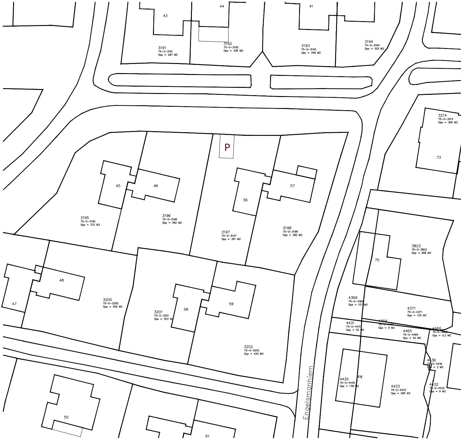
Bestaande situatie Bebouwd oppervlak 50m 2