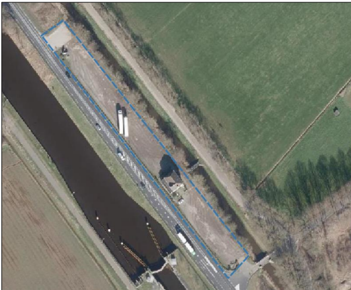
Figuur 1. Locatie Bosscheweg 5 te Erp. De activiteiten vinden plaats binnen het blauw omliggende gebied.