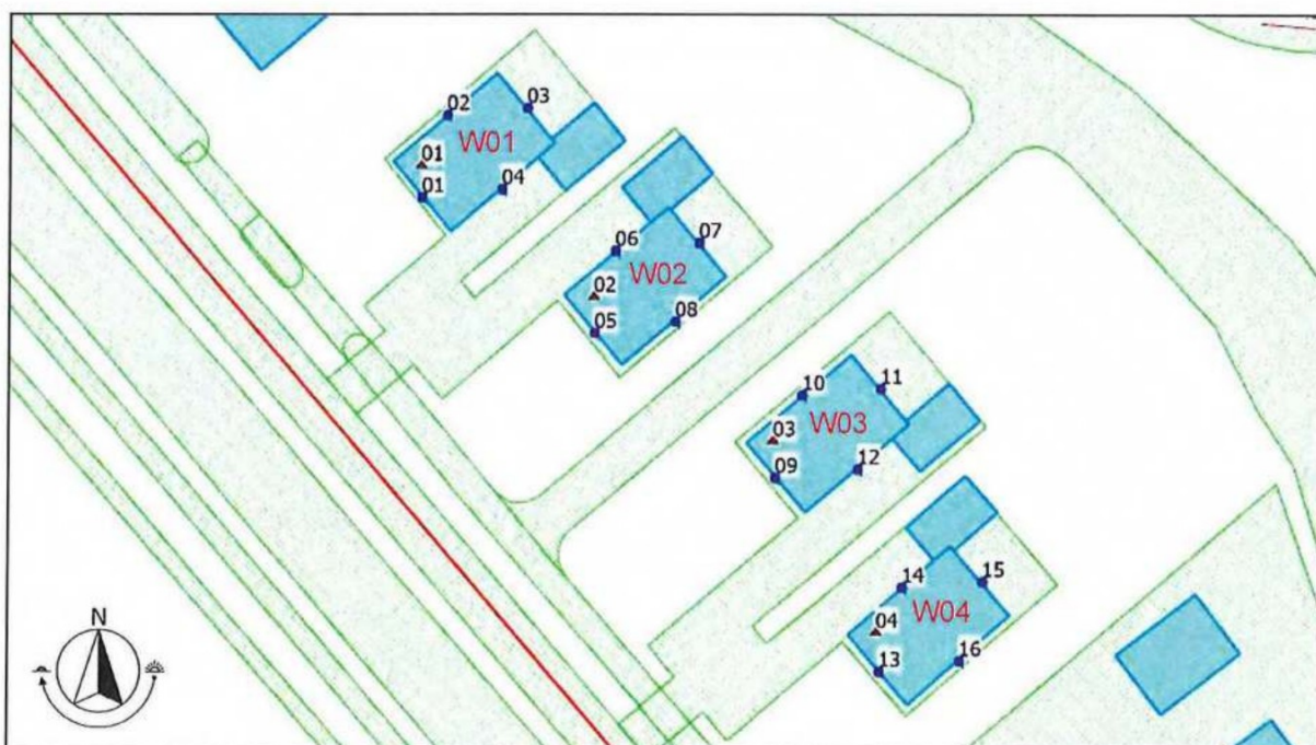
Figuur 2: Ontvangerpunten [bron: akoestisch onderzoek wegverkeerslawaa]i