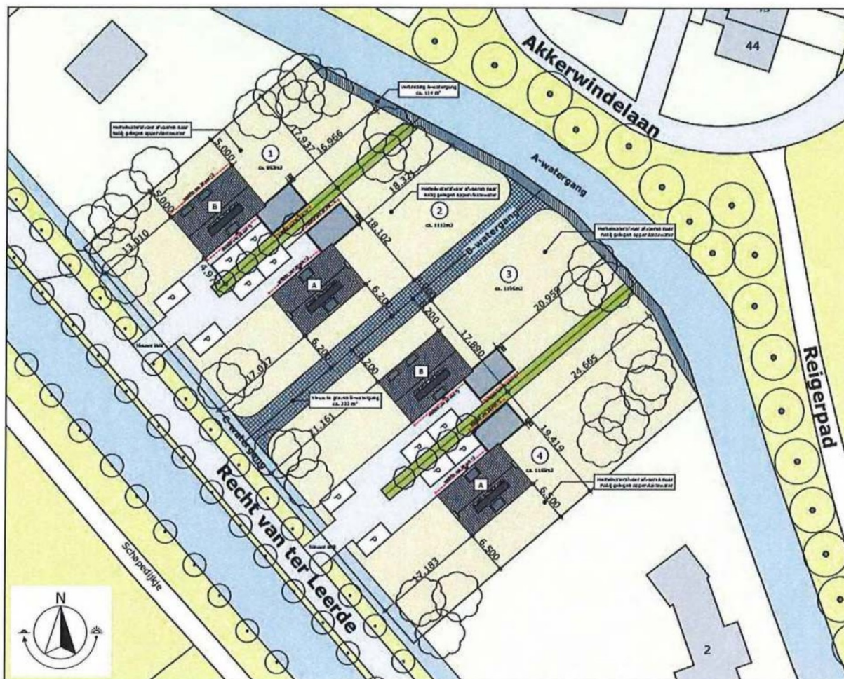
Figuur 1: Nieuwe situatie [bron: aanvraag omgevingsvergunning, situatietekening V3, d.d. 17-11-2023]