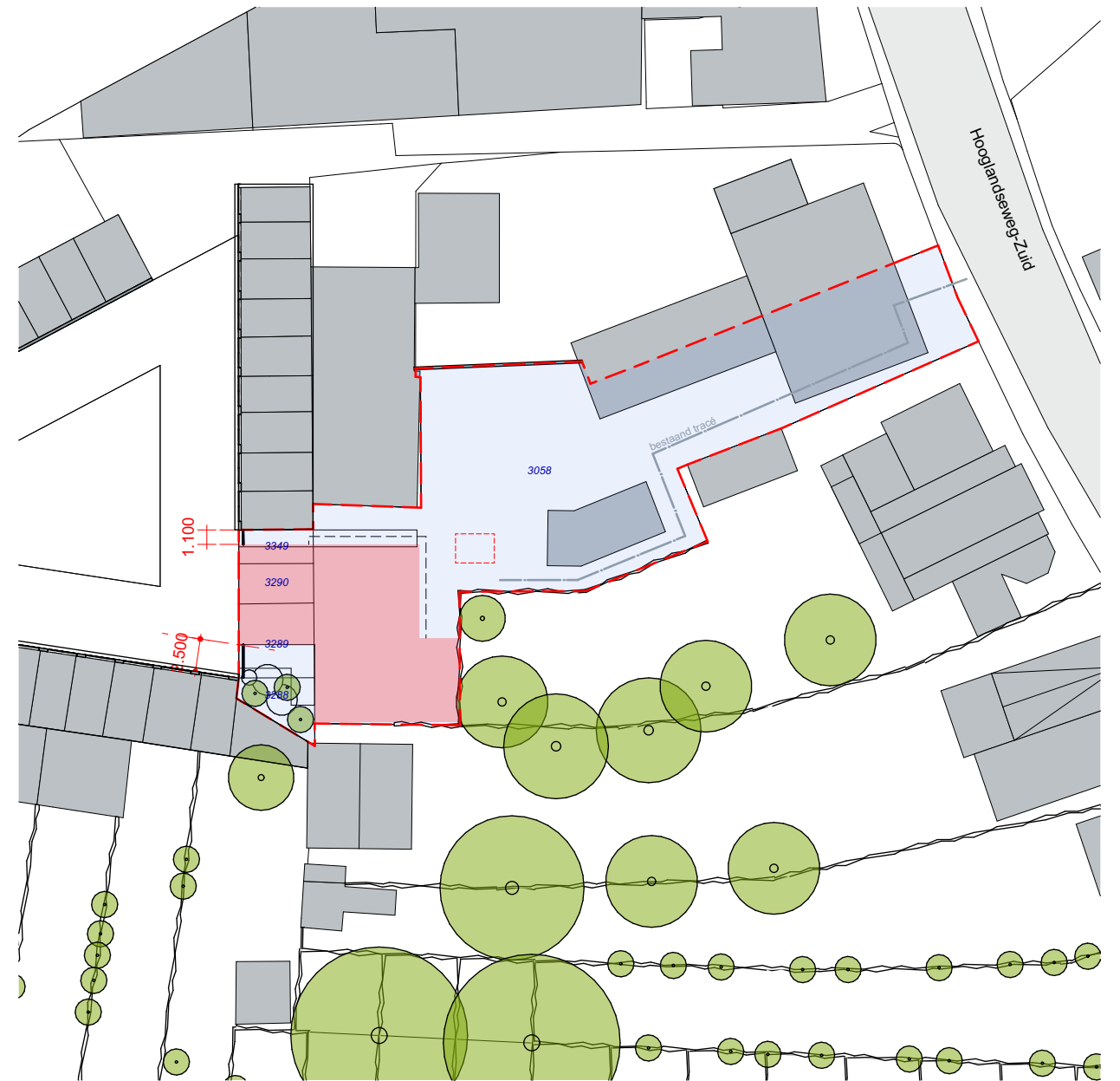
Kadastrale situatie 1:500