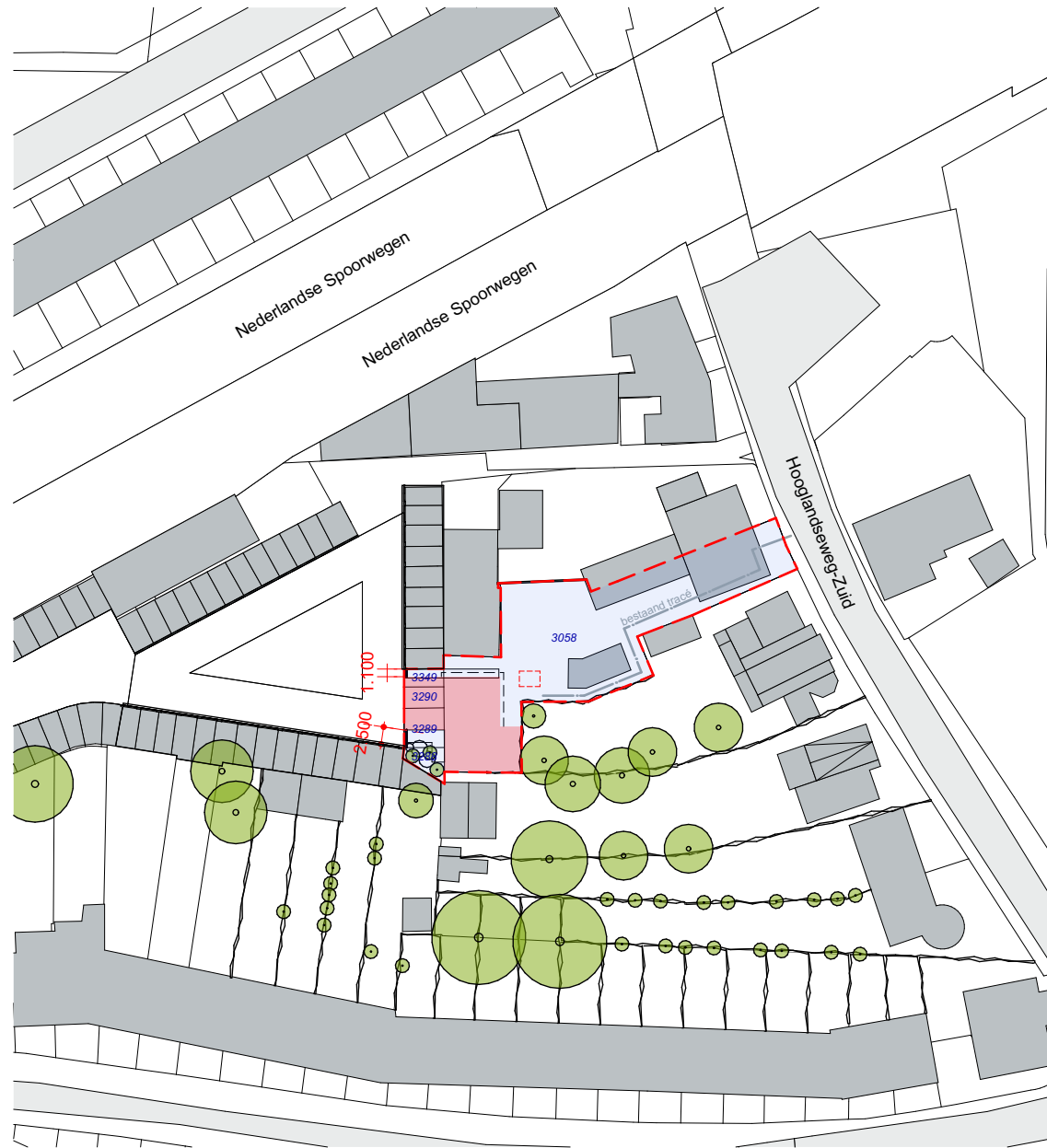
Kadastrale situatie 1:1000