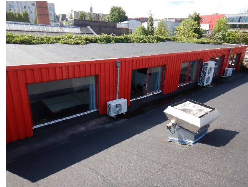
westzijde aanbouw, bovendaks