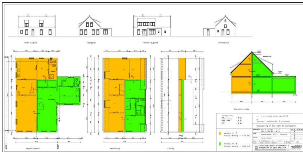
Figuur 2: Splitsing woningen Koenderseweg 7-9 Oosterwijk

Koenderseweg 7 = oranje gekleurde vlakken