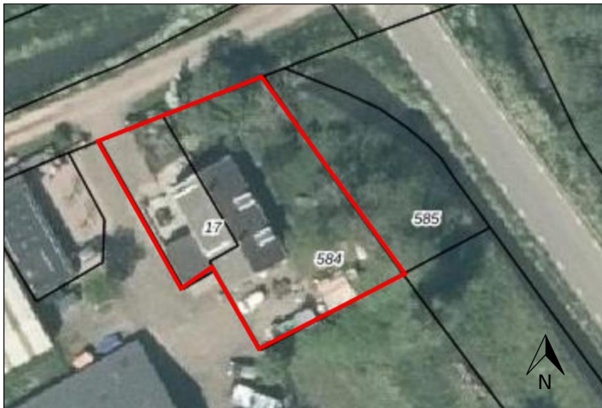
Figuur 1: Ligging en begrenzing plangebied