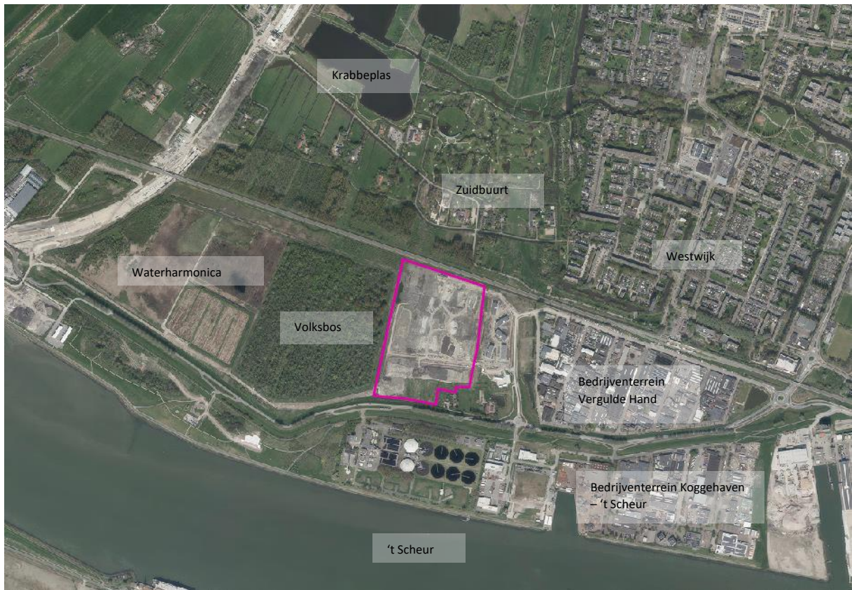
Figuur 3: Locatie nieuwe zuivering op Vergulde Hand West in Vlaardingen