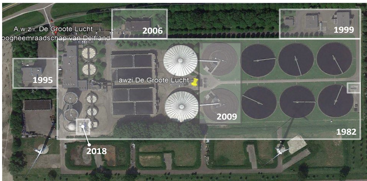
Figuur 1 Boven-aanzicht huidige AWZI DGL, waarbij te zien is dat deze in de loop der jaren steeds is aangepast.