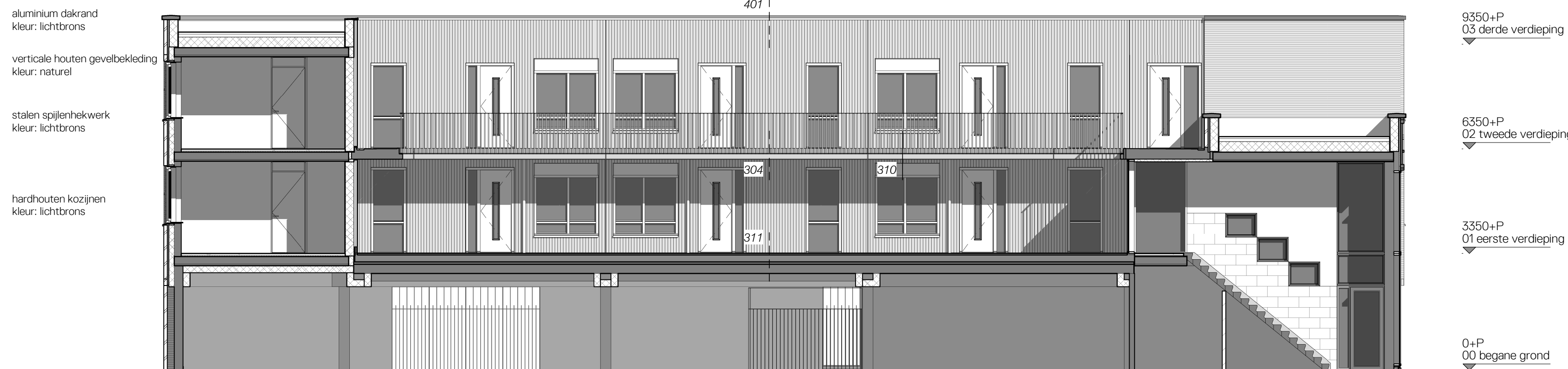
4 binnengevel - laagbouw 1:100