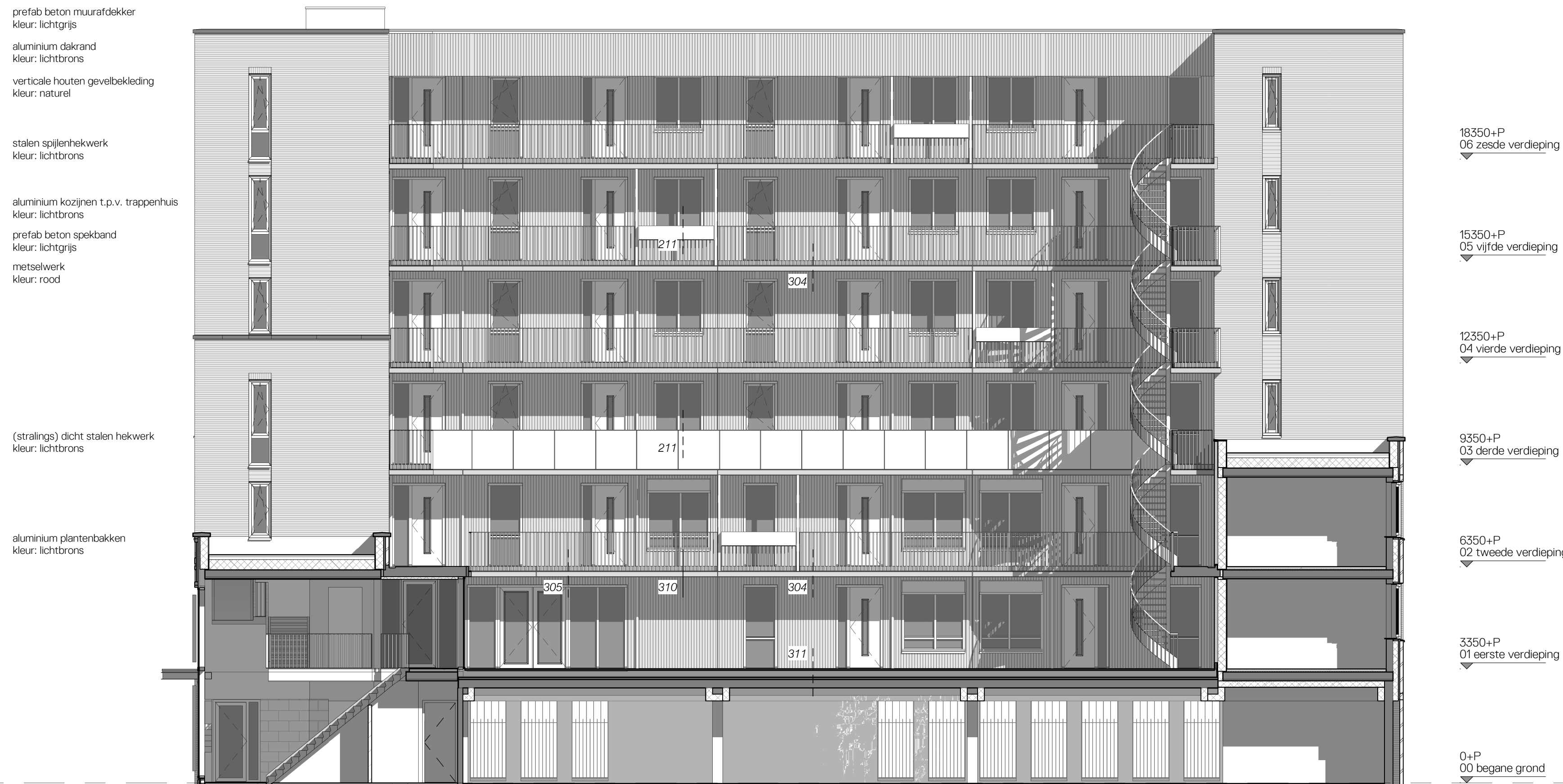
2 binnengevel - hoogbouw 1:100