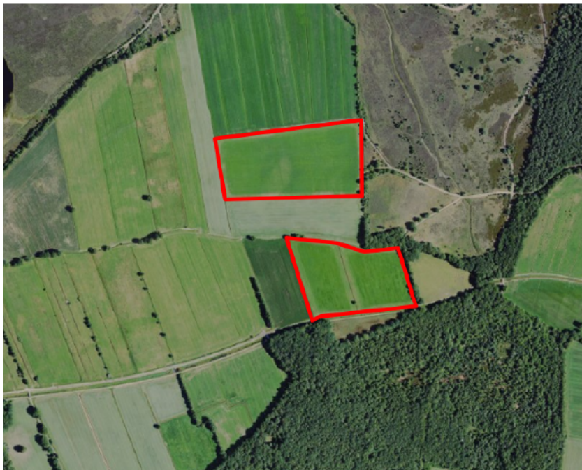
Figuur 1. percelen omgevingsvergunning

Wij hebben besloten op basis van onderstaande motivering aan u op basis van artikel 5.1 lid 2, aanhef en onder g, van de Omgevingswet (Ow) in samenhang met art. 11.37 en art. 11.40 van het Besluit activiteiten leefomgeving (Bal) een omgevingsvergunning te verlenen voor het doden van grauwe ganzen met behulp van geweer ter ondersteuning van de aangebrachte preventieve middelen vanaf één uur voor zonsopkomst ter voorkoming van belangrijke schade aan kwetsbare gewassen op de percelen uit uw aanvraag zoals weergegeven op onderstaande figuur 1.