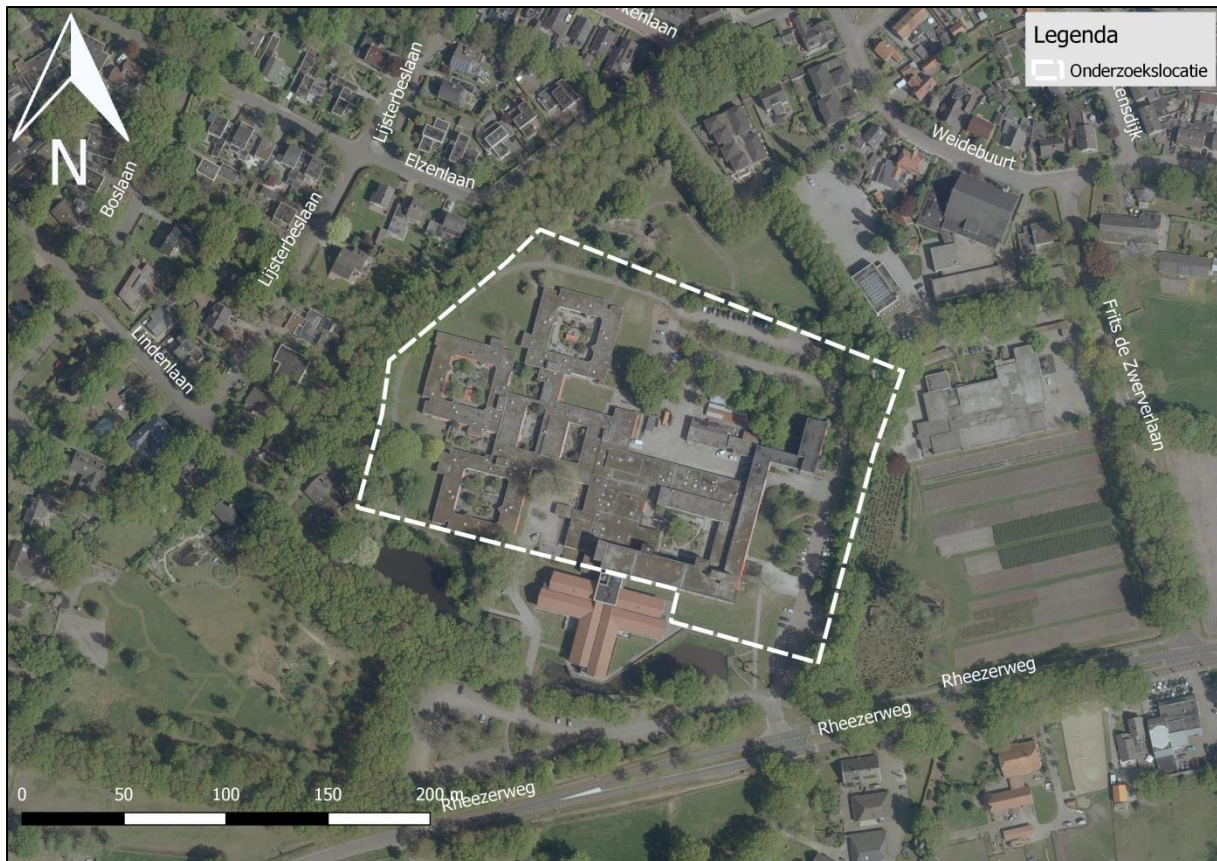
Figuur 2. Luchtfoto onderzoekslocatie en directe omgeving.