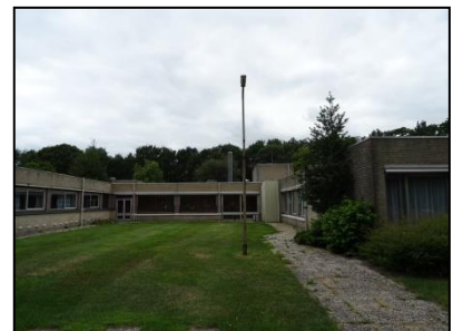
Figuur 5. Woningcomplex en aangrenzende groenstrook op het noordelijk deel van de onderzoekslocatie.