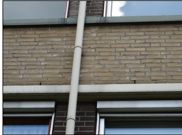
Figuur 10. Ruimte achter daktrim en zonwering.

De aanwezige bomen op de onderzoekslocatie zijn onderzocht op holtes, spleten en/of loshangend schors, wat kan dienen als potentiële vaste rust- en verblijfplaats voor boombewonende vleermuizen. De meeste bomen binnen de onderzoekslocatie zijn jong en ongeschikt als verblijfplaats. De grote beeldbepalende bomen blijven zoveel mogelijk staan en zijn eveneens ongeschikt als verblijfplaats. Daarmee zijn verblijfplaatsen van boombewonende vleermuizen uit te sluiten.