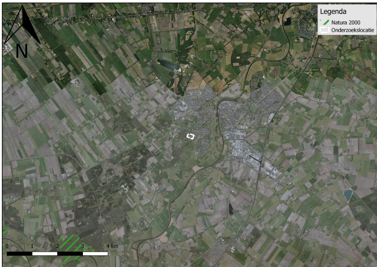
Figuur 11. Ligging onderzoekslocatie ten opzichte van Natura 2000.

De onderzoekslocatie is niet gelegen binnen de grenzen, of in de directe nabijheid van een gebied dat aangewezen is als Natura 2000. Het meest nabijgelegen Natura 2000-gebied, Vecht- en Beneden-Reggegebied, bevindt zich op circa 5,9 kilometer afstand ten zuidwesten van de onderzoekslocatie (zie figuur 11).