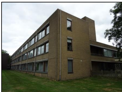
Figuur 3. Zicht op het meest zuidelijke complex, grenzend aan het gebouw uit 2006.