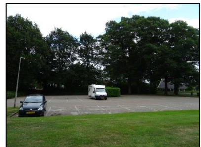
Figuur 8. Parkeerplaats aan de oostzijde van de onderzoekslocatie.