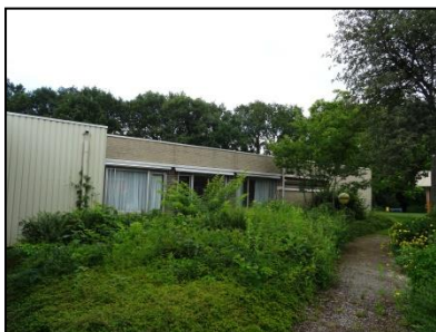
Figuur 6. Wandelpad op het westelijk deel van de onderzoekslocatie.