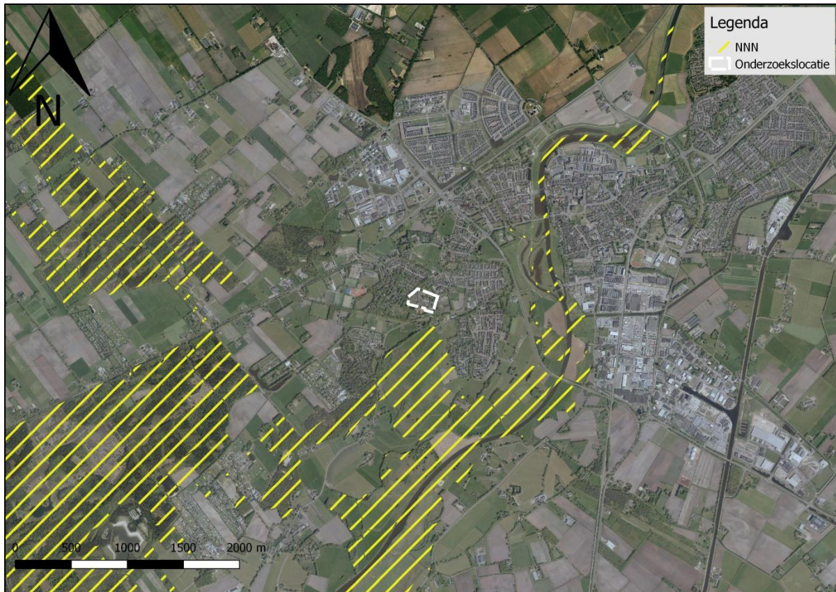
Figuur 12. Ligging onderzoekslocatie ten opzichte van het Natuurnetwerk Nederland.

De onderzoekslocatie maakt geen deel uit van het Natuurnetwerk. De onderzoekslocatie ligt echter wel in de nabijheid van een gebied, behorend tot het Natuurnetwerk Nederland. Het meest nabijgelegen gebied bevindt zich circa 200 meter ten zuiden van de onderzoekslocatie. In figuur 12 is de ligging van de onderzoekslocatie ten opzichte van het Natuurnetwerk Nederland weergegeven.