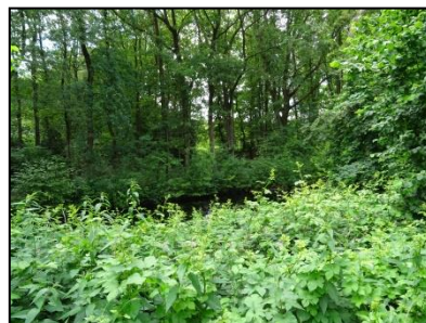
Figuur 7. Watergang aan de zuidzijde van de onderzoekslocatie.