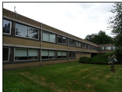
Figuur 4. Zicht op het meest oostelijke complex, gezien vanuit oostelijke richting.