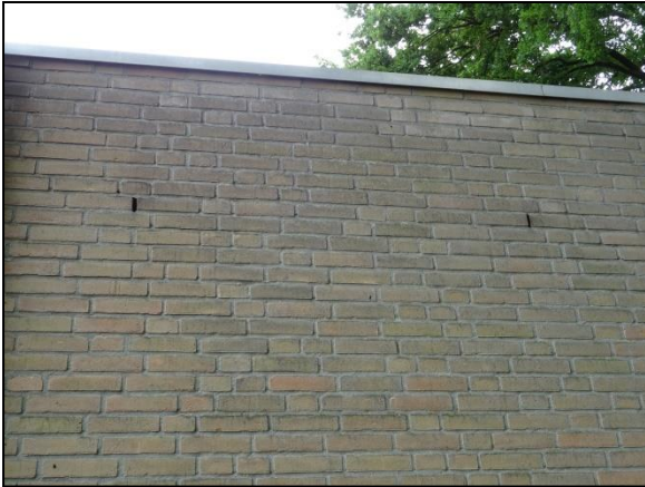
Figuur 9. Stootvoegen in de gevel van de te slopen gebouwen.

ruimtes achter betimmeringen, de zonwering en de doorvoer van de regenpijp waargenomen die vleermuizen kunnen gebruiken als vaste rust- en/of verblijfplaats. Het gehele complex is daardoor geschikt als verblijfplaats voor gebouwbewonende soorten als gewone dwergvleermuis en laatvlieger. Deze soorten kunnen de bebouwing in principe gebruiken als zomer-, kraam-, paar- en winterverblijfplaats. Bij de sloop van de bebouwing kan daarom sprake zijn van verstoring en vernietiging ten aanzien van een vaste rust- en verblijfplaats van desbetreffende soorten (zie hoofdstuk 6).