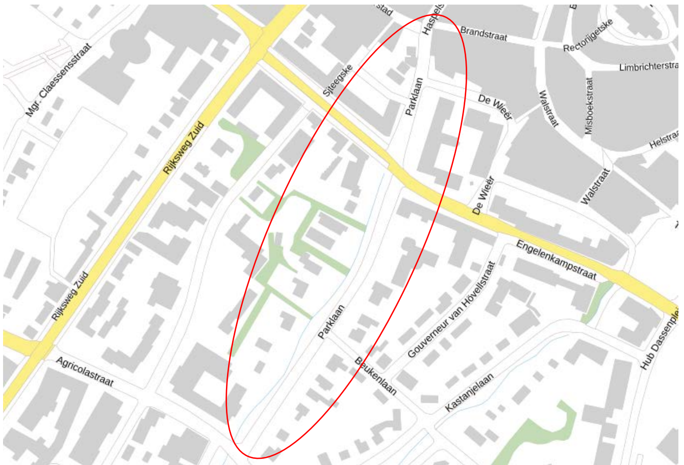
Figuur 1: Situatie Parklaan met woningen

In Figuur 1 is het projectgebied weergegeven van de beek langs de Parklaan, tussen de Agricolastraat en de Brandstraat.