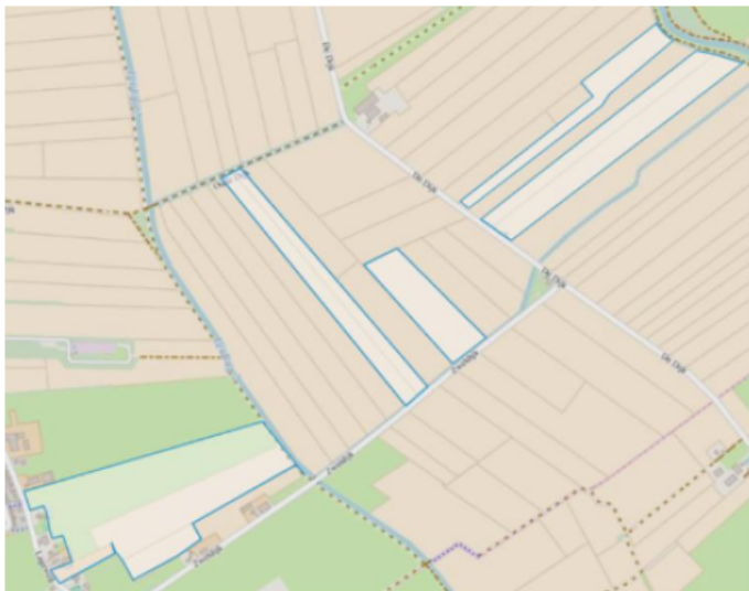
Figuur 1. percelen omgevingsvergunning

Wij hebben besloten op basis van onderstaande motivering aan u op basis van artikel 5.1 lid 2, aanhef en onder g, van de Omgevingswet (Ow) in samenhang met art. 11.37 en art. 11.40 van het Besluit activiteiten leefomgeving (Bal) een omgevingsvergunning te verlenen voor het doden van grauwe ganzen met behulp van geweer ter ondersteuning van de aangebrachte preventieve middelen vanaf één uur voor zonsopkomst ter voorkoming van belangrijke schade aan kwetsbare gewassen op de percelen uit uw aanvraag zoals weergegeven op onderstaande figuur 1.