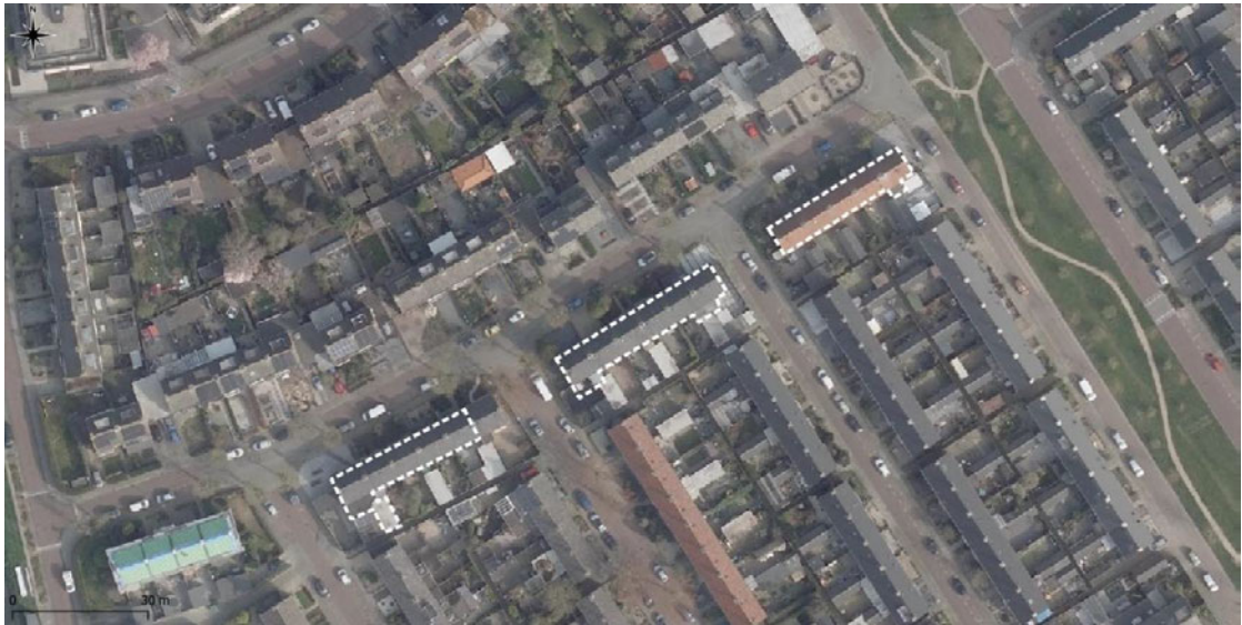
Figuur 1 Luchtfoto onderzoekslocatie en directe omgeving.