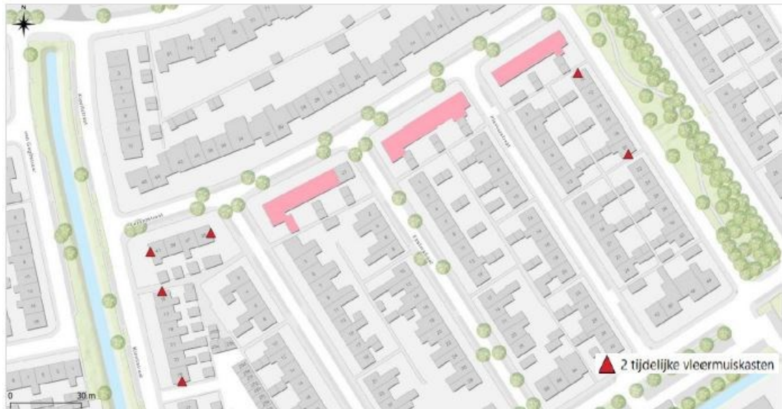
Figuur 3 Locaties van de tijdelijke voorzieningen in de directe omgeving van de planlocatie.