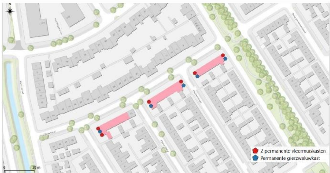
Figuur 4 Locaties van de permanente voorzieningen in de toekomstige situatie.