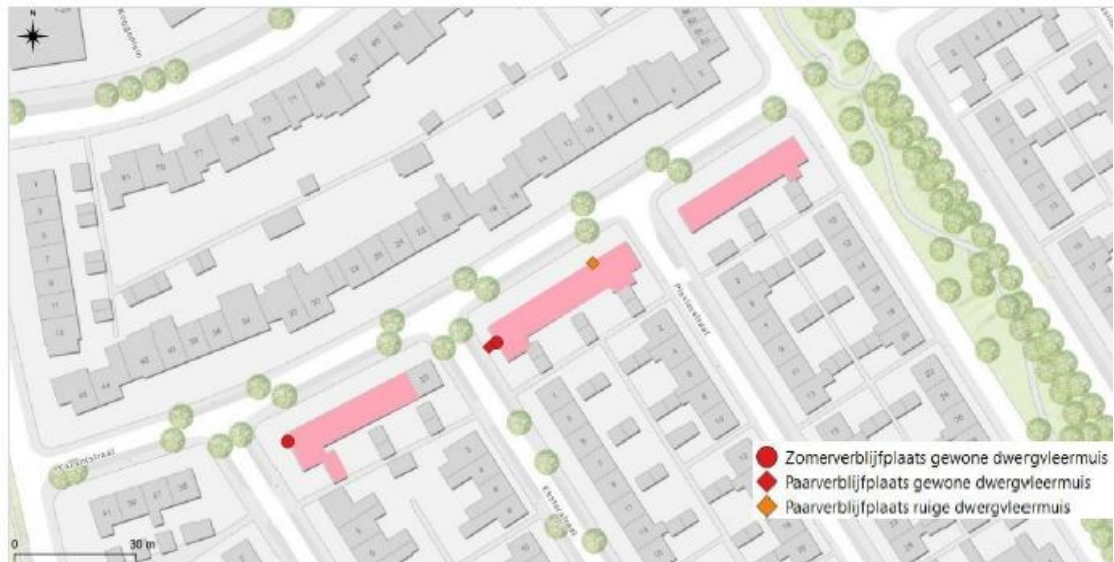
Figuur 2 Verspreiding van vleermuissoorten op basis van inventarisatie in het seizoen 2023.