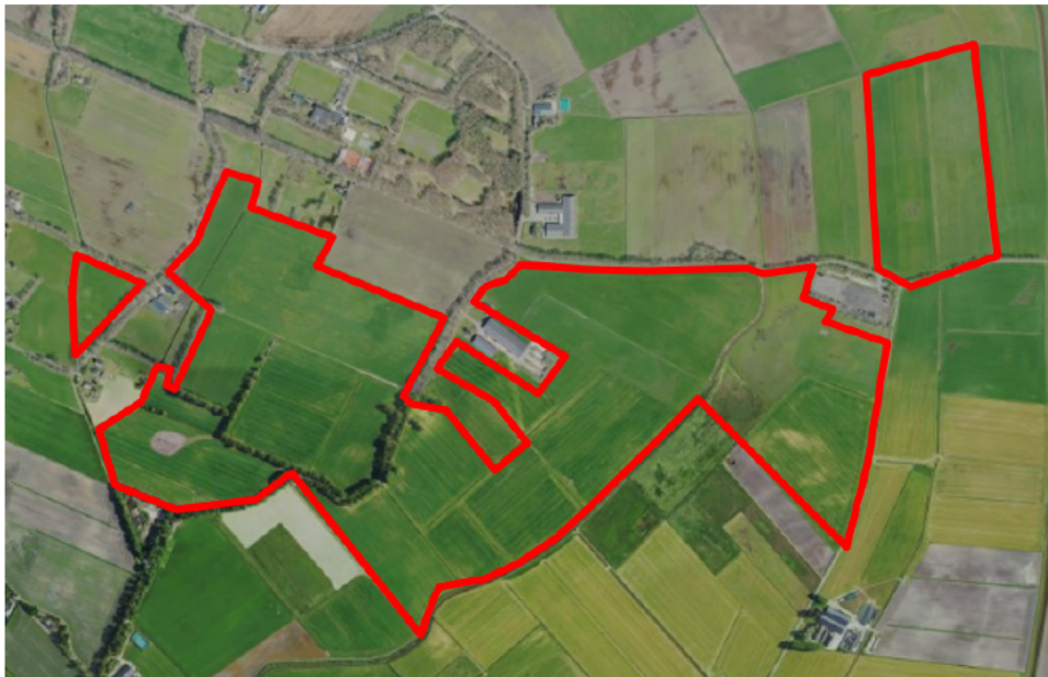
Figuur 1. percelen omgevingsvergunning

Wij hebben besloten op basis van onderstaande motivering aan u op basis van artikel 5.1 lid 2, aanhef en onder g, van de Omgevingswet (Ow) in samenhang met art. 11.37 en art. 11.40 van het Besluit activiteiten leefomgeving (Bal) een omgevingsvergunning te verlenen voor het doden van grauwe ganzen met behulp van geweer ter ondersteuning van de aangebrachte preventieve middelen vanaf één uur voor zonsopkomst ter voorkoming van belangrijke schade aan kwetsbare gewassen op de percelen uit uw aanvraag zoals weergegeven op onderstaande figuur 1.