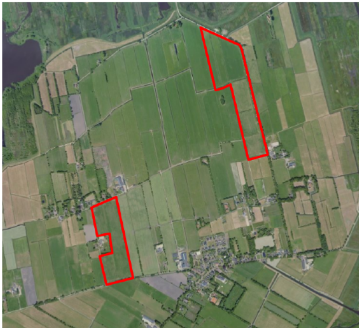
Figuur 1. percelen omgevingsvergunning

Wij hebben besloten op basis van onderstaande motivering aan u op basis van artikel 5.1 lid 2, aanhef en onder g, van de Omgevingswet (Ow) in samenhang met art. 11.37 en art. 11.40 van het Besluit activiteiten leefomgeving (Bal) een omgevingsvergunning te verlenen voor het doden van grauwe ganzen met behulp van geweer ter ondersteuning van de aangebrachte preventieve middelen vanaf één uur voor zonsopkomst ter voorkoming van belangrijke schade aan kwetsbare gewassen op de percelen uit uw aanvraag zoals weergegeven op onderstaande figuur 1.