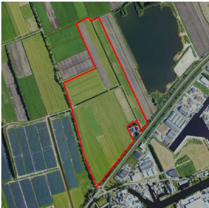
Figuur 1. percelen omgevingsvergunning

Wij hebben besloten op basis van onderstaande motivering aan u op basis van artikel 5.1 lid 2, aanhef en onder g, van de Omgevingswet (Ow) in samenhang met art. 11.37 en art. 11.40 van het Besluit activiteiten leefomgeving (Bal) een omgevingsvergunning te verlenen voor het doden van grauwe ganzen met behulp van geweer ter ondersteuning van de aangebrachte preventieve middelen vanaf één uur voor zonsopkomst ter voorkoming van belangrijke schade aan kwetsbare gewassen op de percelen uit uw aanvraag zoals weergegeven op onderstaande figuur 1.