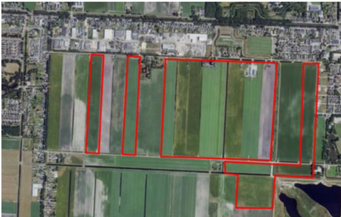
Figuur 1. percelen omgevingsvergunning

Wij hebben besloten op basis van onderstaande motivering aan u op basis van artikel 5.1 lid 2, aanhef en onder g, van de Omgevingswet (Ow) in samenhang met art. 11.37 en art. 11.40 van het Besluit activiteiten leefomgeving (Bal) een omgevingsvergunning te verlenen voor het doden van grauwe ganzen met behulp van geweer ter ondersteuning van de aangebrachte preventieve middelen vanaf één uur voor zonsopkomst ter voorkoming van belangrijke schade aan kwetsbare gewassen op de percelen uit uw aanvraag zoals weergegeven op onderstaande figuur 1.