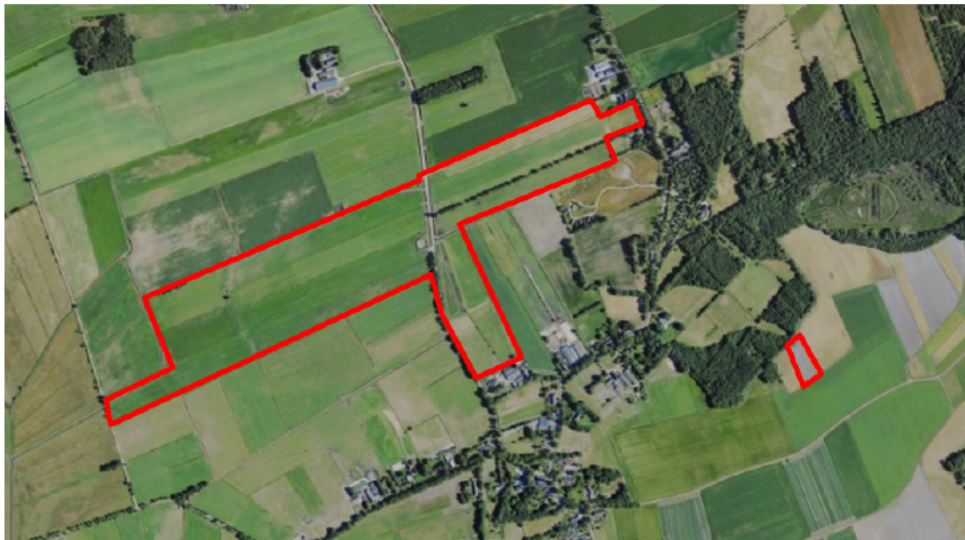
Figuur 1. percelen omgevingsvergunning

Wij hebben besloten op basis van onderstaande motivering aan u op basis van artikel 5.1 lid 2, aanhef en onder g, van de Omgevingswet (Ow) in samenhang met art. 11.37 en art. 11.40 van het Besluit activiteiten leefomgeving (Bal) een omgevingsvergunning te verlenen voor het doden van grauwe ganzen met behulp van geweer ter ondersteuning van de aangebrachte preventieve middelen vanaf één uur voor zonsopkomst ter voorkoming van belangrijke schade aan kwetsbare gewassen op de percelen uit uw aanvraag zoals weergegeven op onderstaande figuur 1.