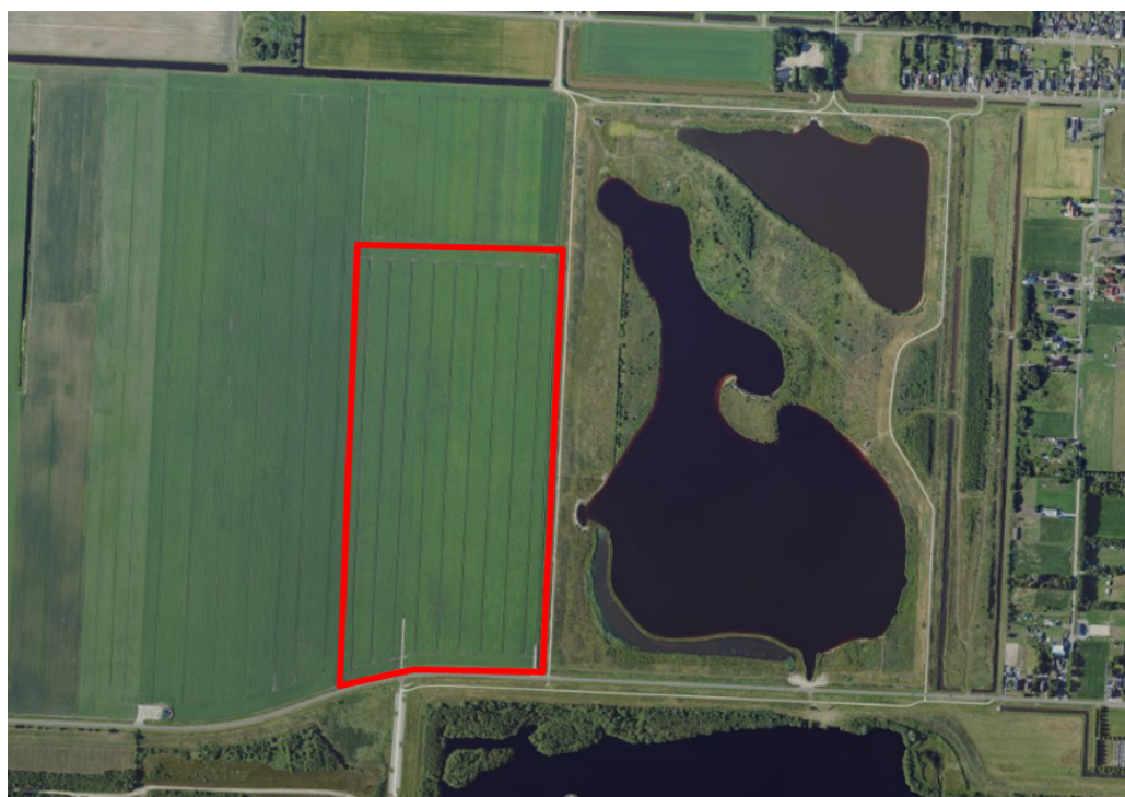
Figuur 1. percelen omgevingsvergunning

Wij hebben besloten op basis van onderstaande motivering aan u op basis van artikel 5.1 lid 2, aanhef en onder g, van de Omgevingswet (Ow) in samenhang met art. 11.37 en art. 11.40 van het Besluit activiteiten leefomgeving (Bal) een omgevingsvergunning te verlenen voor het doden van grauwe ganzen met behulp van geweer ter ondersteuning van de aangebrachte preventieve middelen vanaf één uur voor zonsopkomst ter voorkoming van belangrijke schade aan kwetsbare gewassen op de percelen uit uw aanvraag zoals weergegeven op onderstaande figuur 1.