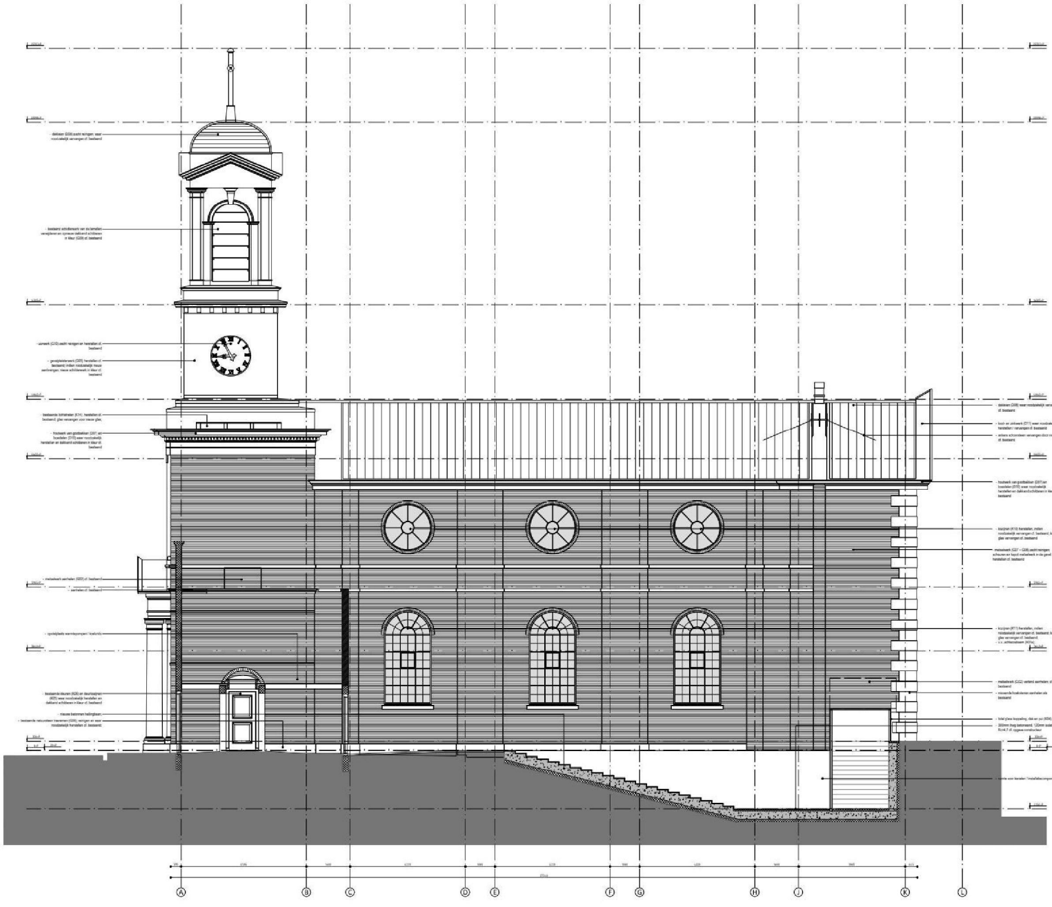
NIEUWE SITUATIE NOORDGEVEL schaal 1:100

RENOVOOI Algemeen: - Trappen meetbaar conform Bouwbesluit 2012, art. 2.5, par. 2.3.1, artikel 3.7. - Brandveiligheidsmaatregelen conform Bouwbesluit 2012, art. 2.3, par. 2.3.1, artikel 2.21. - Brandveiligheidsmaatregelen conform Bouwbesluit 2012, art. 2.3, par. 2.3.1. - Toelichting op de maatregelen conform Bouwbesluit 2012 art. 3.10, artikel 3.71. Constructie: - Binnendeuren hoofdconstructie conform reguleer constructeur - Binnendeuren hoofdconstructie conform reguleer constructeur, adviseur brand en bouwbesluit 2012 art. 2.10, par. 2.10.1, art. 2.85 Installaties: - Ventilatie/ luchtovervoer conform Bouwbesluit 2012 art. 3.8, par. 3.8 en ventilator adviseur ERM. - Wateraansluiting en Wasmachine conform reguleer constructeur ERM en Bouwbesluit 2012 art. 3.3, art. 3.1, 1/10 g.s.a. - Verwarming conform reguleer constructeur ERM. - De voorzieningen van elektriciteit zullen worden voorzien volgens het Eet deze worden aan NEN1010 bij lag spanning en NEN EN-IEC 61335-1 en NEN EN 50522, bij laagspanning. Brandcompartimentering en positieve brandmiddelen, vluchtwegbeveiliging en rookverlichting conform reguleer constructeur Bouwbesluit