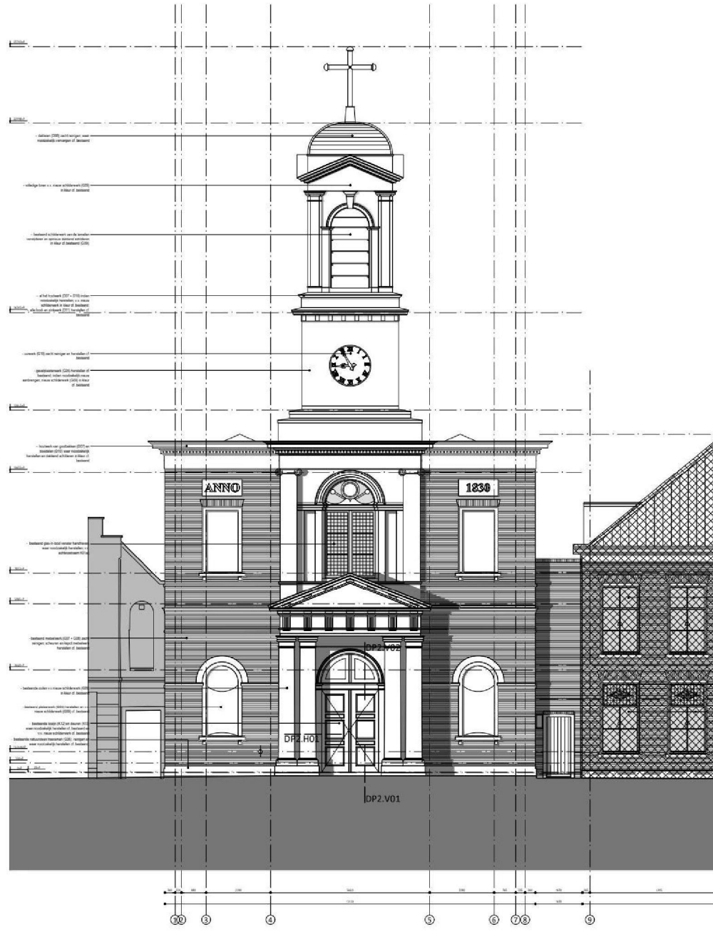
NIEUWE SITUATIE OOSTGEVEL schaal 1:100