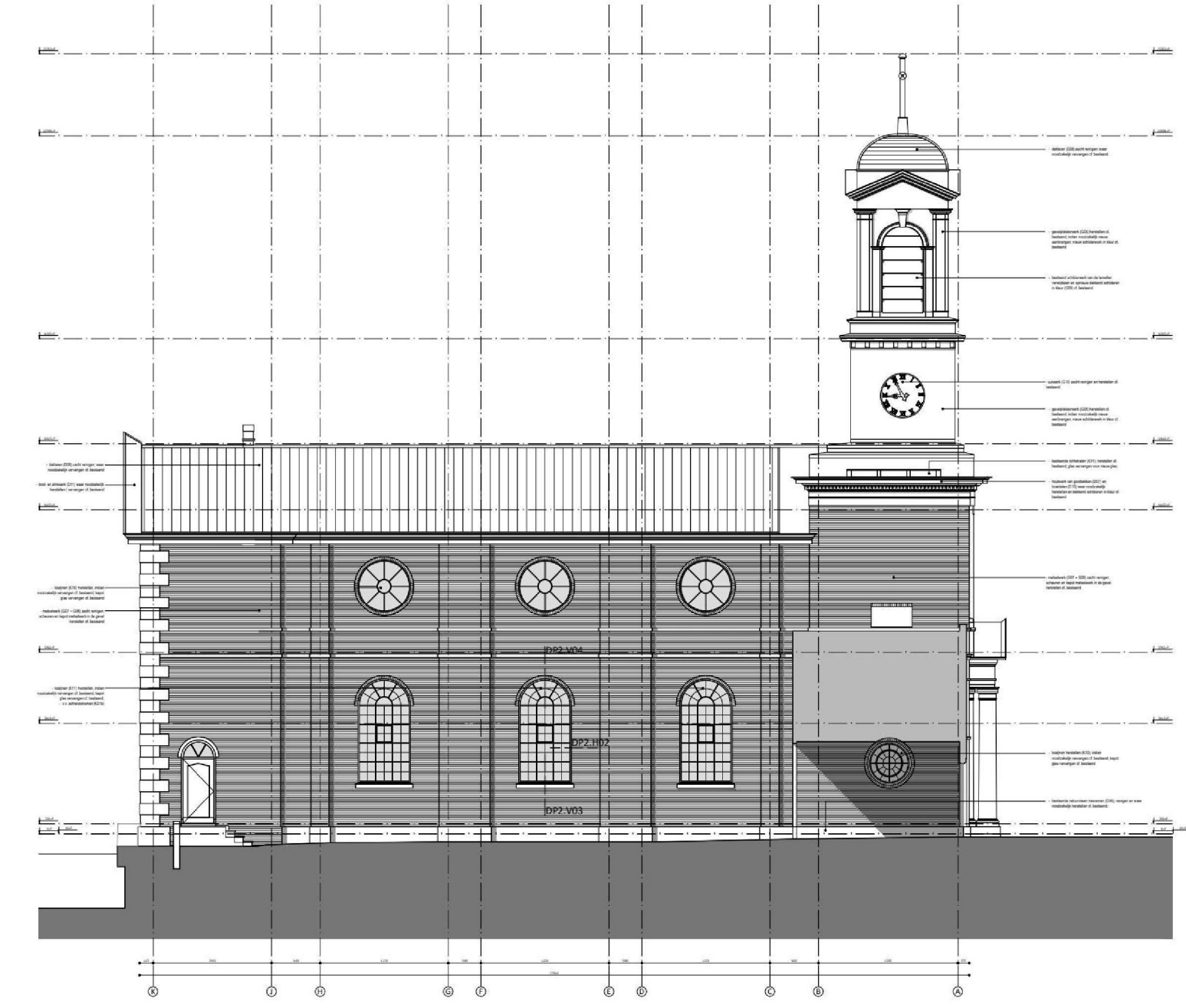
NIEUWE SITUATIE ZUIDGEVEL schaal 1:100