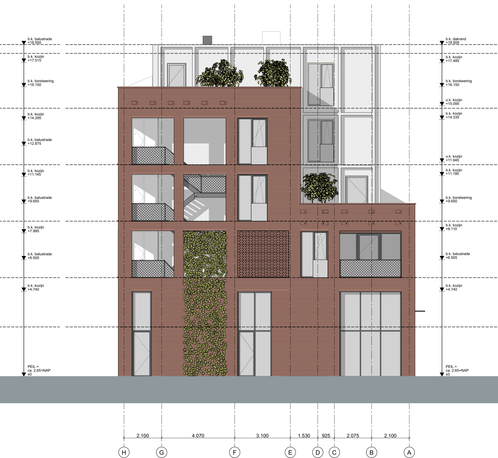
LINKER ZIJGEVEL | NOORD-WEST