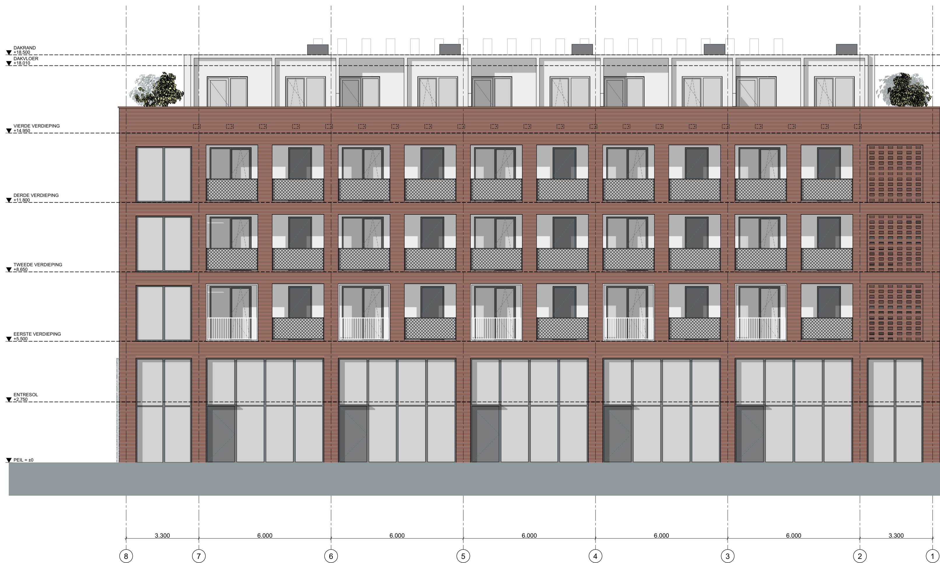
ACHTERGEVEL | NOORD-OOST