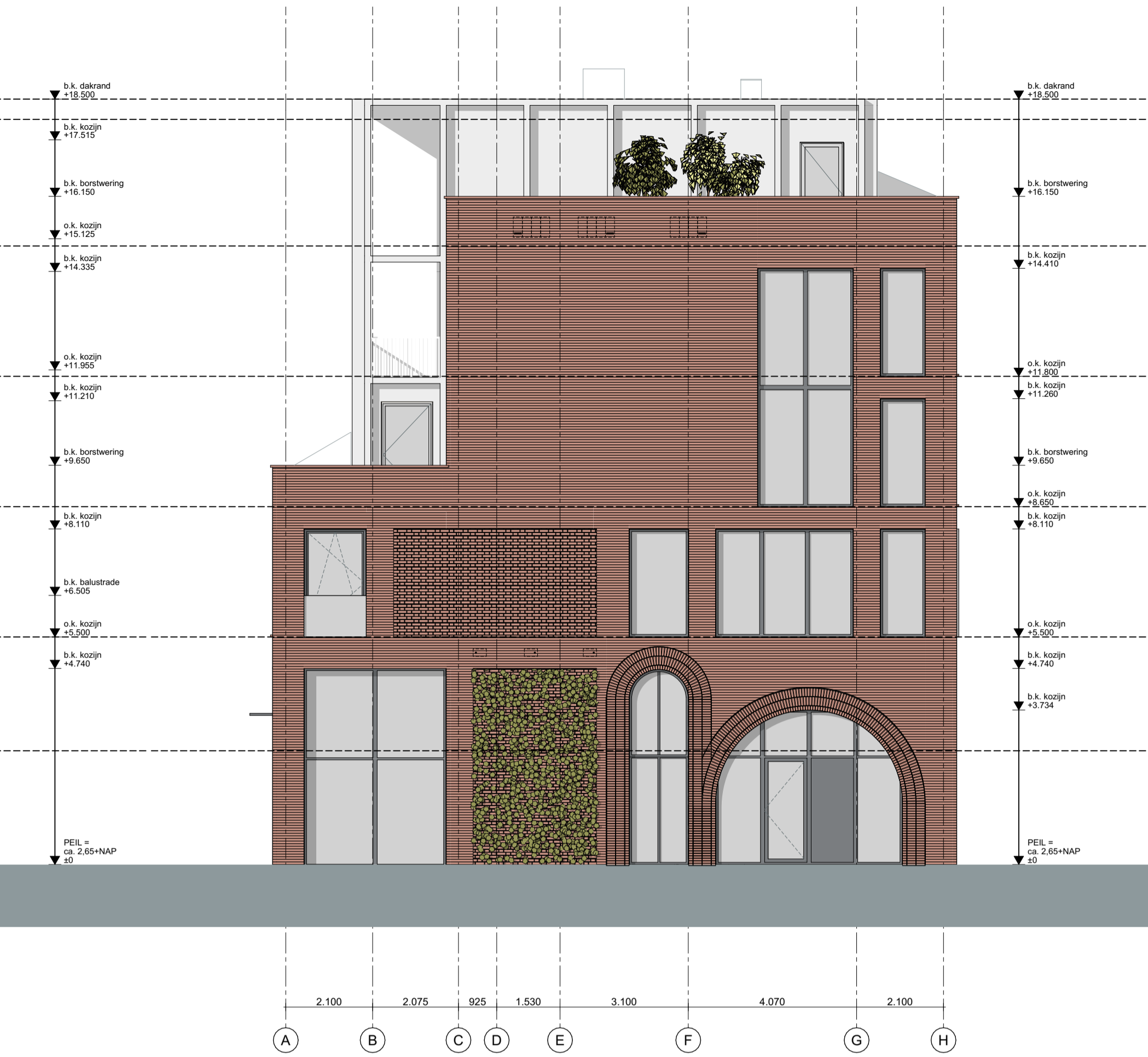
RECHTER ZIJGEVEL | ZUID-OOST