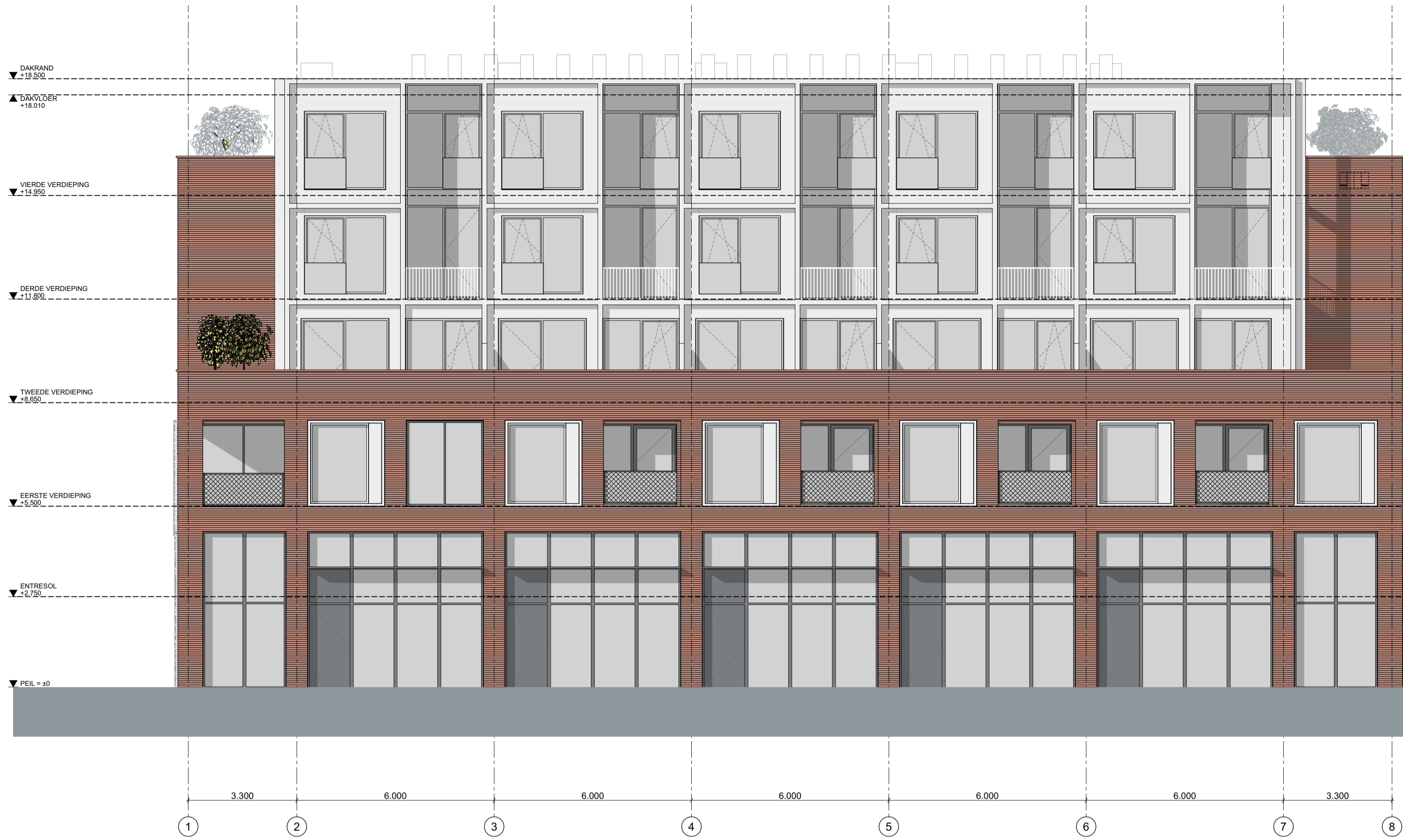
VOORGEVEL | ZUID-WEST