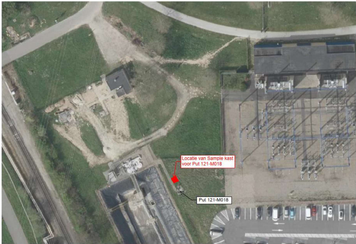
Figuur 2. Detail locatie shelter