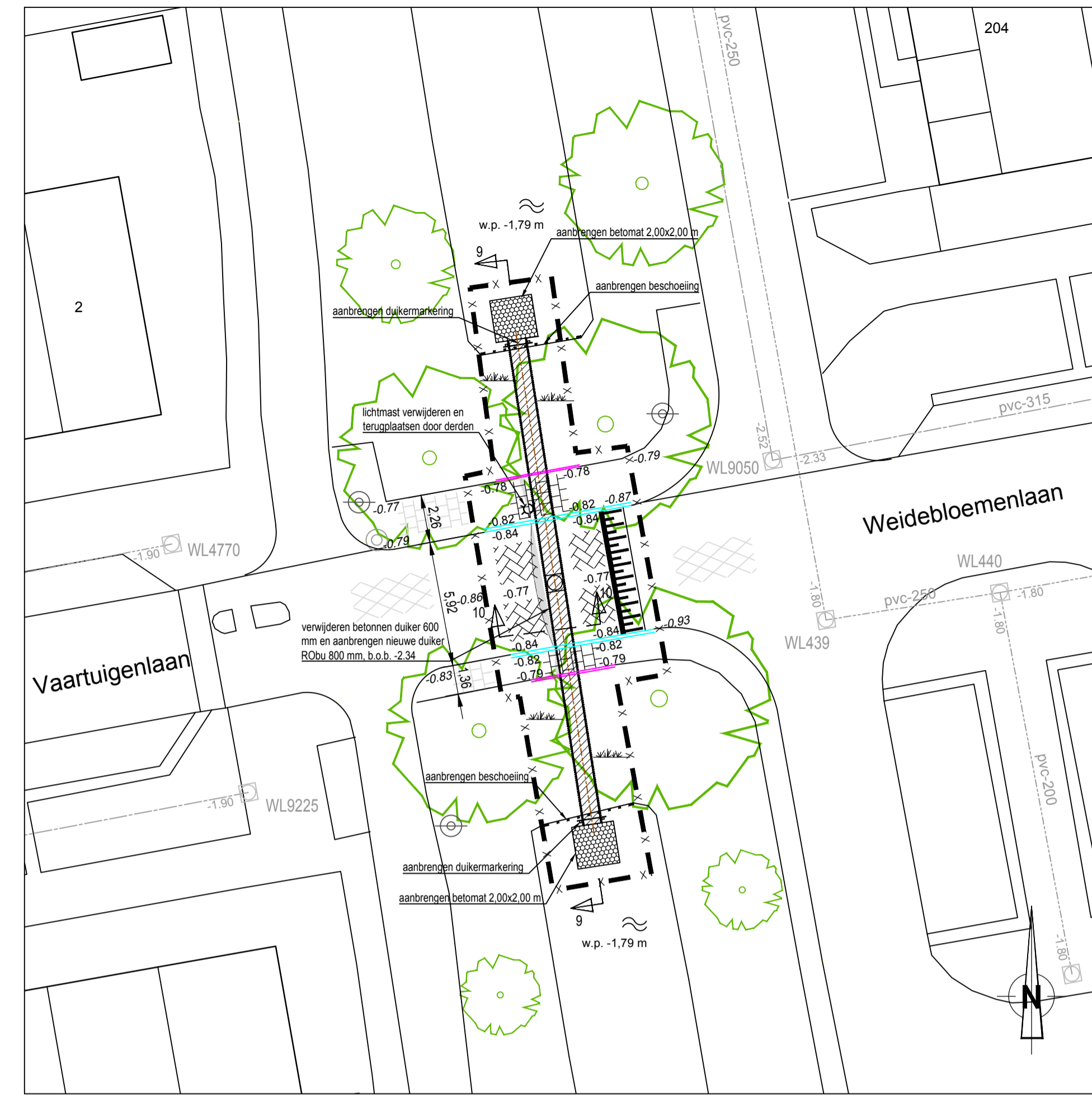
NIEUWE SITUATIE SCHAAL 1:200

Opmerkingen alle maten in m, materiaalmaten in mm hoogtematen in m t.o.v. N.A.P.