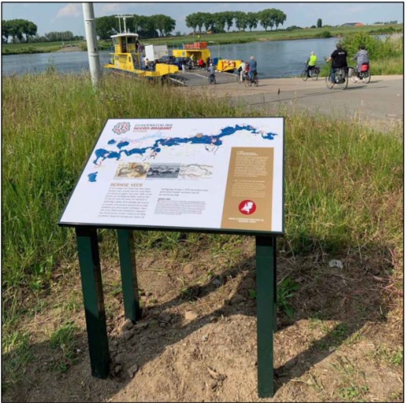
Wenselijke uitstraling informatiebord, elders in linie