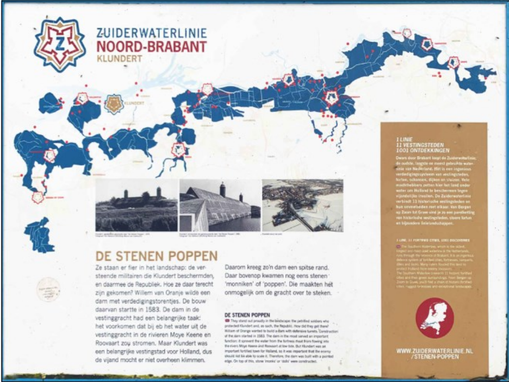
Bestaand informatiebord bij Stenen Poppen (handhaven)