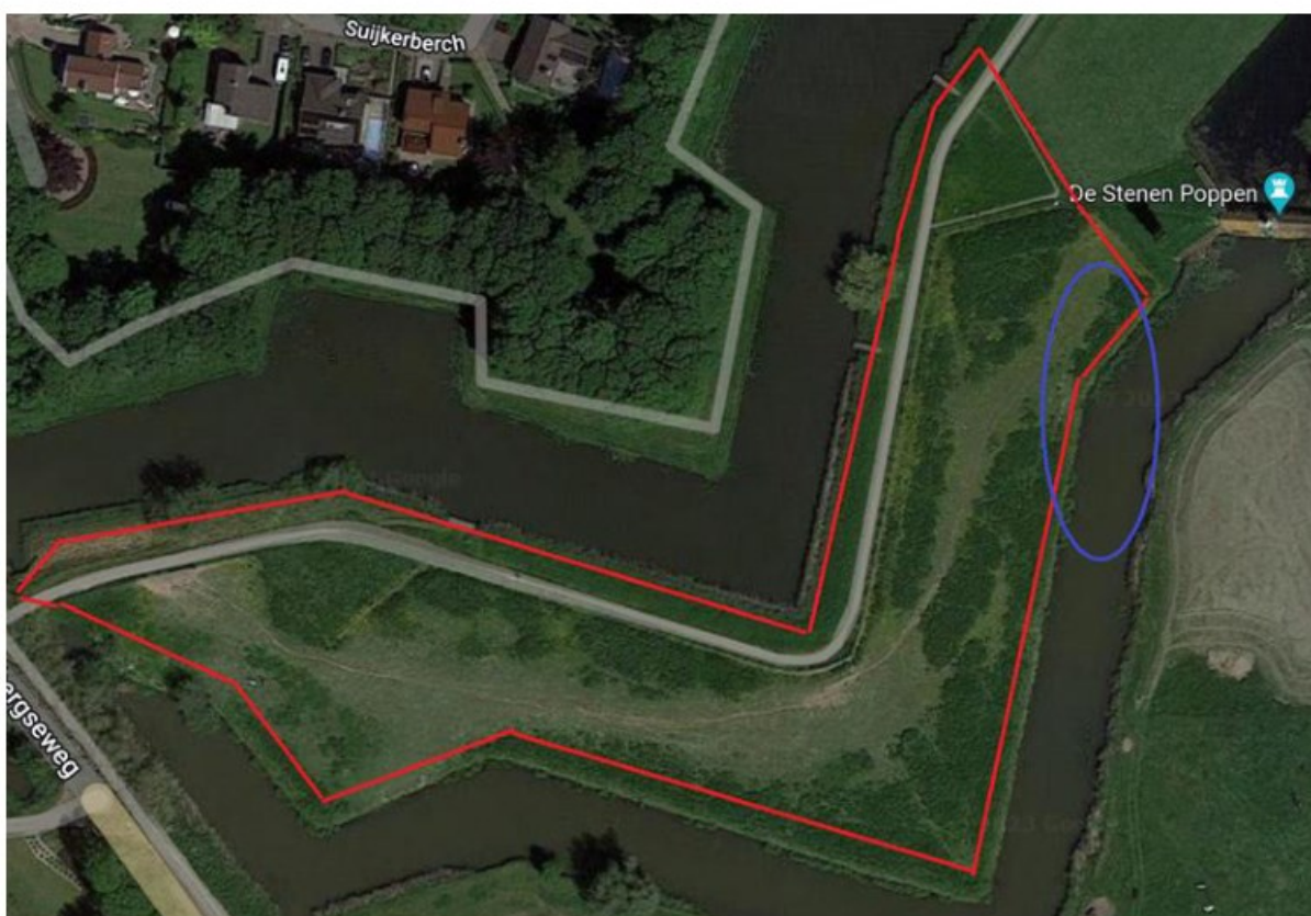
Figuur 1: Ligging van het plangebied (rood gearceerd).

Het plangebied, de Stenen Poppen, bevindt zich in Klundert en grenst aan de Zevenbergseweg (figuur 1). Het plangebied bevindt zich in een grondwal, welke onderdeel is van een vesting. Rondom het plangebied is water aanwezig in de vorm van een gracht. Het plangebied zelf bestaat uit een weiland die begraaasd wordt door pony's. Er staat een solitaire wilg in het plangebied, deze heeft geen holtes of losse bast. Hij maakt geen onderdeel uit van een mogelijke foerageerroute. De wilg is max. 50 cm dik en bevat geen holtes. Er zijn geen gebouwen aanwezig.