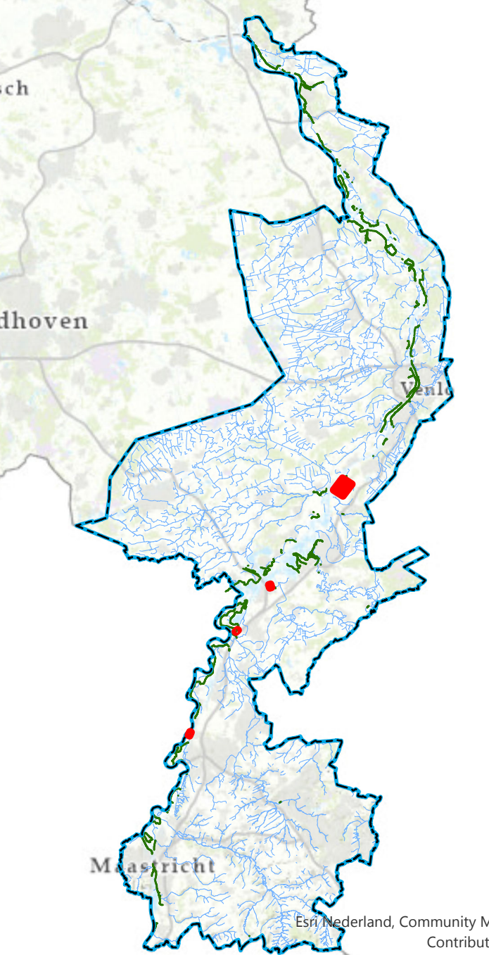
Overzichtskaartje (schaal 1:650.000)