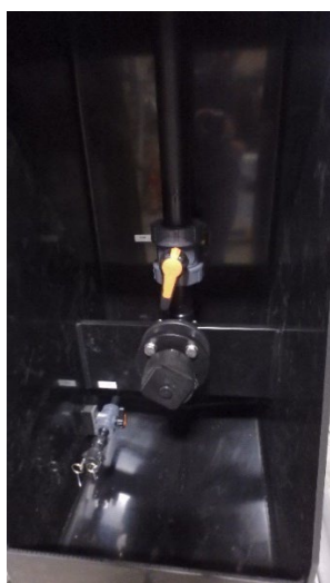
Foto 1 en 2; vulkast met afsluitbare kap, vulleiding met AKZO koppeling