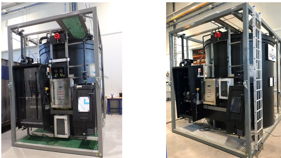
Foto 3; Chemdose: chemicaliën opslagtank en lekbak in stalen frame