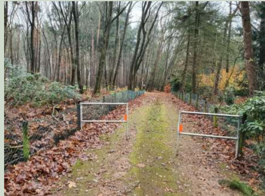
Te formaliseren inrit

Dit onderzoek is gericht om een inschatting te maken of beschermde soorten voorkomen en gebruik maken van de projectlocatie.