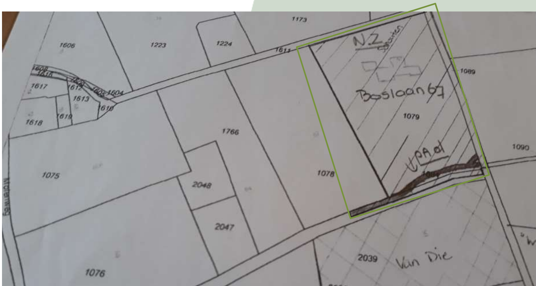
Figuur 1 planlocatie