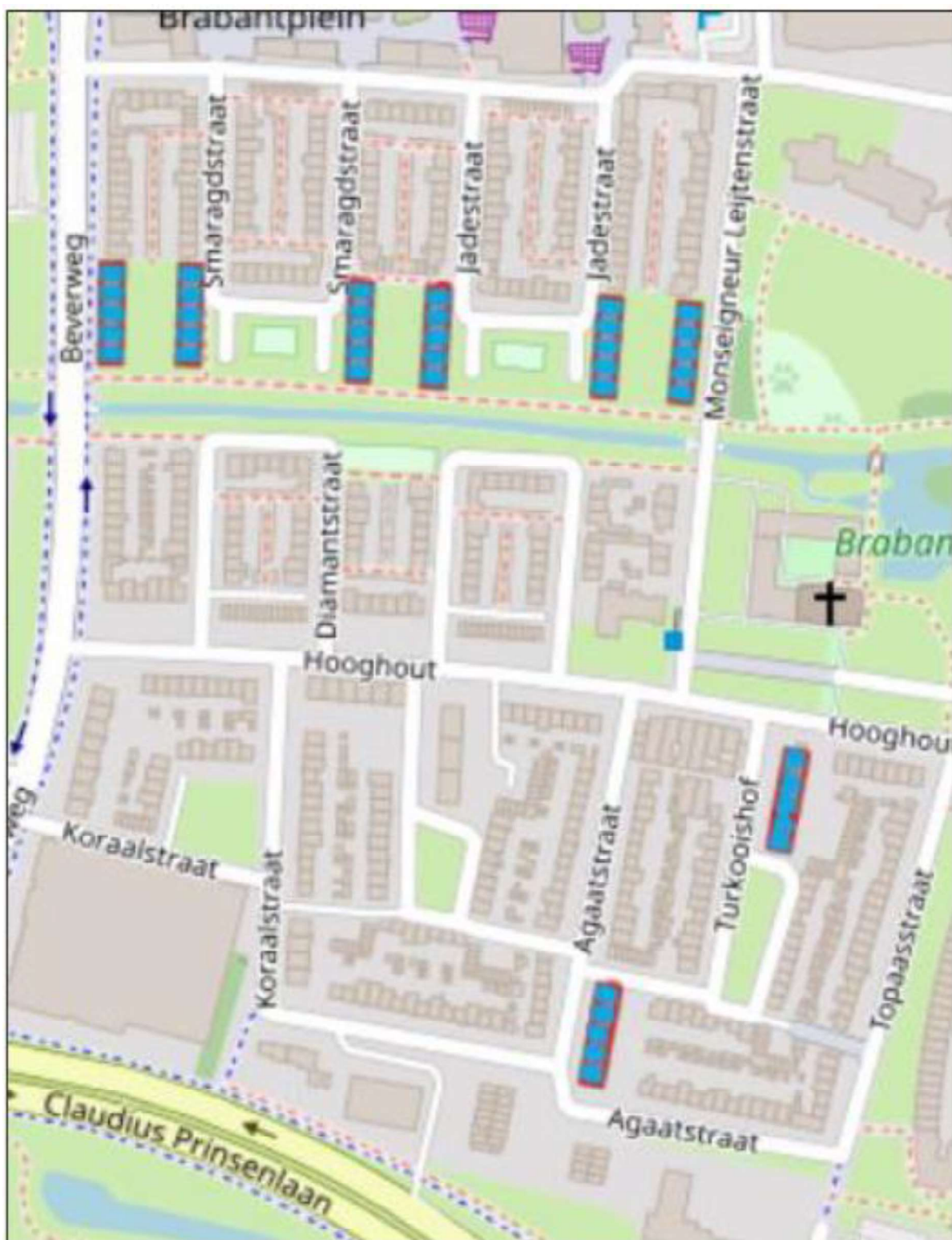
Figuur 1. Locatie Mgr. Leijtenstraat e.o. De activiteiten vinden plaats binnen het de rood omlijnende, blauwe blokken.