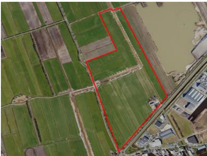
Figuur 1. percelen ontheffing

Wij hebben besloten op basis van onderstaande motivering aan u een ontheffing te verlenen op basis van artikel 3.3 van de Wet natuurbescherming (Wnb) voor het doden van grauwe ganzen met behulp van geweer ter ondersteuning van de aangebrachte preventieve middelen vanaf één uur voor zonsopkomst ter voorkoming van belangrijke schade aan kwetsbare gewassen op de percelen uit uw aanvraag zoals weergegeven op onderstaande figuur 1.