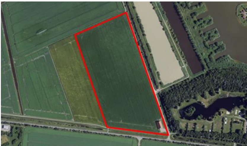
Figuur 1. percelen ontheffing

Wij hebben besloten op basis van onderstaande motivering aan u een ontheffing te verlenen op basis van artikel 3.3 van de Wet natuurbescherming (Wnb) voor het doden van grauwe ganzen met behulp van geweer ter ondersteuning van de aangebrachte preventieve middelen vanaf één uur voor zonsopkomst ter voorkoming van belangrijke schade aan kwetsbare gewassen op de percelen uit uw aanvraag zoals weergegeven op onderstaande figuur 1.