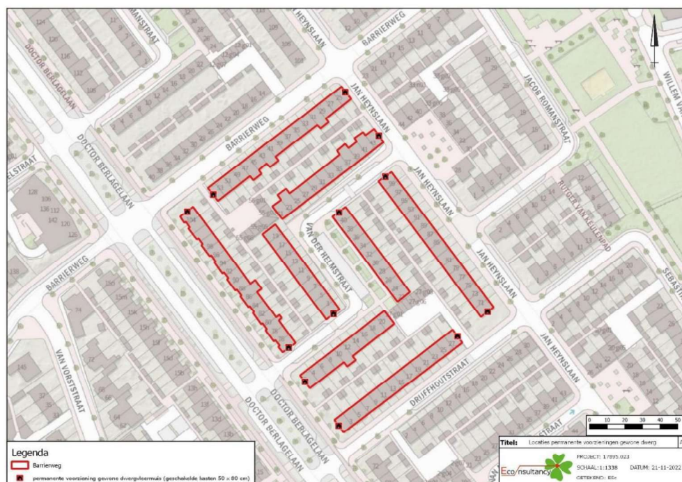
Figuur 3. Locatie van de permanente voorzieningen voor vleermuizen (zwarte stippen).