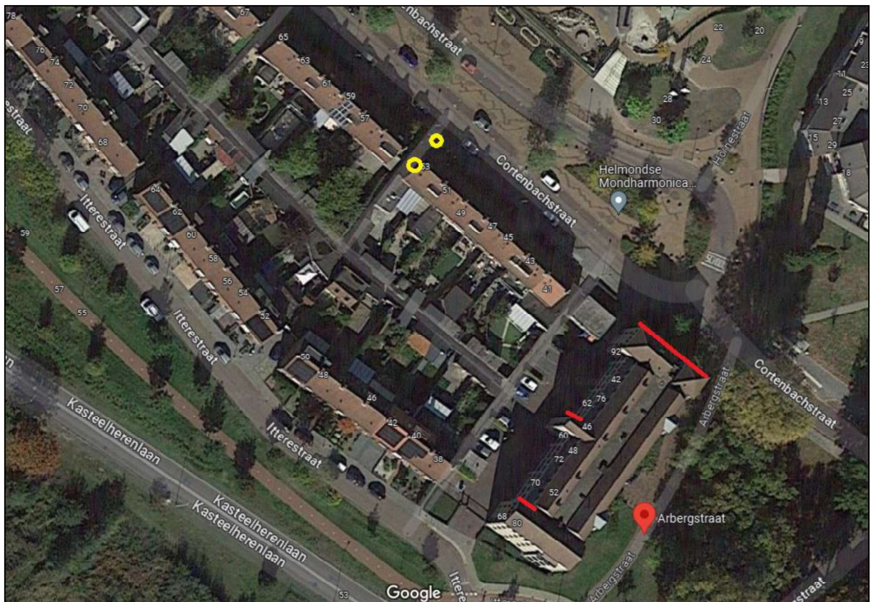
Figuur 2. Rood: locatie van de permanente vervangende nestvoorzieningen voor zowel de huismus en gierzwaluw welke vóór de werkzaamheden worden gerealiseerd. Geel: locatie van twee individuele permanente nestvoorzieningen voor de huismus welke ná de werkzaamheden worden gerealiseerd.