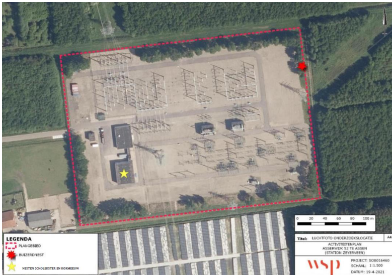
Figuur 1: Rood omlijnd het projectgebied met de rode ster het nest van de buizerd

Op 6 juli 2022 hebben wij een aanvraag ontvangen voor een ontheffing van de Wnb van WSP Nederland B.V. namens SPIE Nederland B.V. (hierna ontheffinghouder). De aanvraag heeft betrekking op het deponeren van het vrijkomende grind, het uitbreiden van de schakeltuin en het verleggen van de bestaande transportroute, gelegen aan de Asserwijk 52 in Assen in de gemeente Assen. De ontheffinghouder heeft ontheffing aangevraagd voor de verbodsbepalingen genoemd in de artikel 3.1, lid 2 en lid 4, van de Wnb voor de buizerd ( Buteo buteo ).